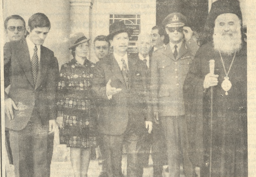
Ο άφίχθεις χθές την πρωίαν Περ. Δ) της Κρήτης ύφ. κ. Π. Φακιολάκης. Παρα πλεύρω η σύζυγός του. Διακρίνονται έπίσης ο Σεβ. Άρχιεπ. Κρήτης κ. Ευγένιος, ο Μέγαρχος ύποστράτηγος κ. Γ. Σχοινιάς και οι κ.κ. Νομαρχία Ηρακλείου και Χανίων (άριστερά).

ΤΗΝ 11ην πρωινήνχθές άφίκετο αεροπορικώς εις Ηράκλειον ο νέος Περιφερειακός Διοικητής Κρήτης ύφυπουργός κ. Παύλος Φακιολάκης. Τόν κ. ύφυπουργόν ύπεδέχθησαν εις τών αερολιμένα οι Νομαρχία Κρήτης, ο διοικητής της 5ης Μεραρχίας, ο Δήμαρχος Κρήτης ο εκπρόσωποι εις την Συμβούλην Λευκήν την Περιφερειαν και το Περιφερειακόν Συμβούλιον οι Προϊστάμενοι τών Διοικητικών ύπηρεσιών τά προεδρεία συλλόγων ένώσεων και άλλων ήτοι και πολλοί φίλοι του.