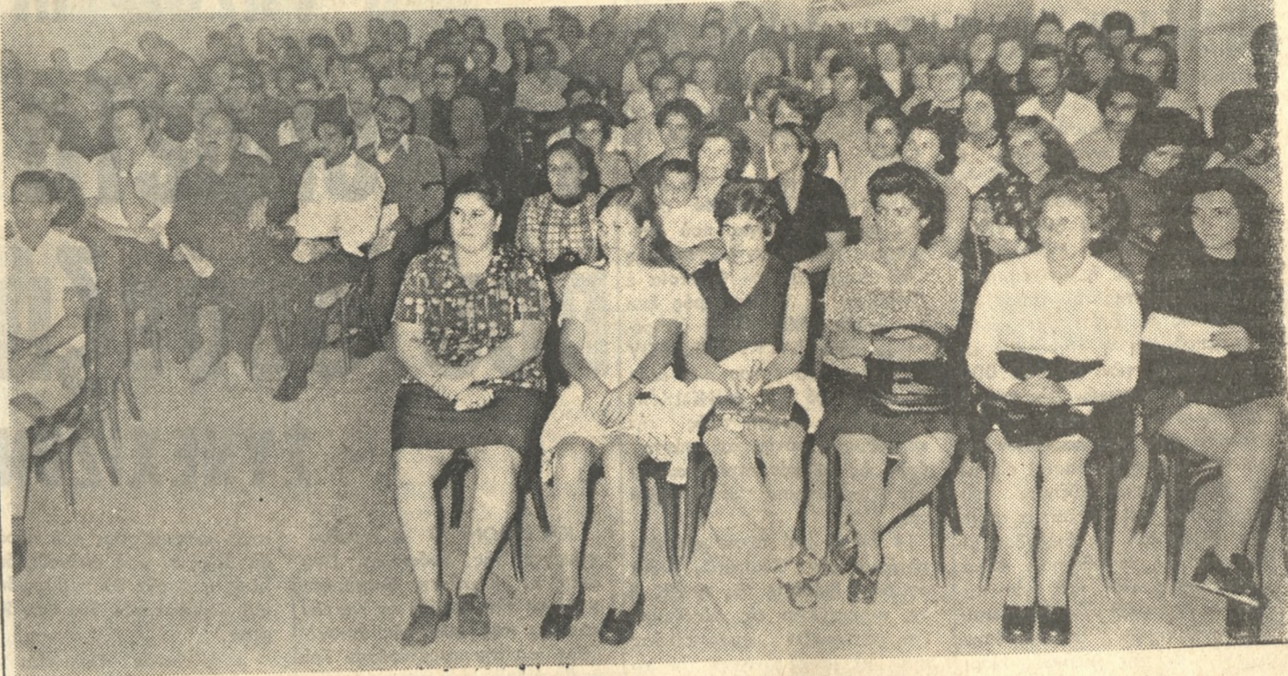
Προχθὲς τὴν Πέμπτην πραγματοποιήθηκε εἰς τὴν αἴθουσαν τοῦ Ἐργατικοῦ Κέντρου Ἡρακλείου γενεὴ συνέλευσις τῶν Ξενοδοχοπαλλήλων. Εἰς τὴν φωτογραφίαν μας εἰκονίζονται σύνεδροι.