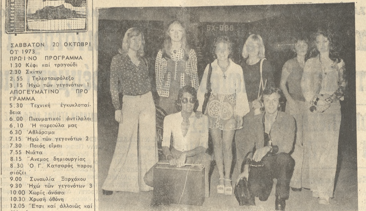
Έμφανίζεται από προχθές, στό Κέντρο «ΑΡΙΑΔΝΗ» τό εικονιζόμενον μπλετίνο HALARIS SHOW. Φωτορεπορτάζ: ΚΟΥΛΑΤΣΟΓΛΟΥ τηλ. 282954