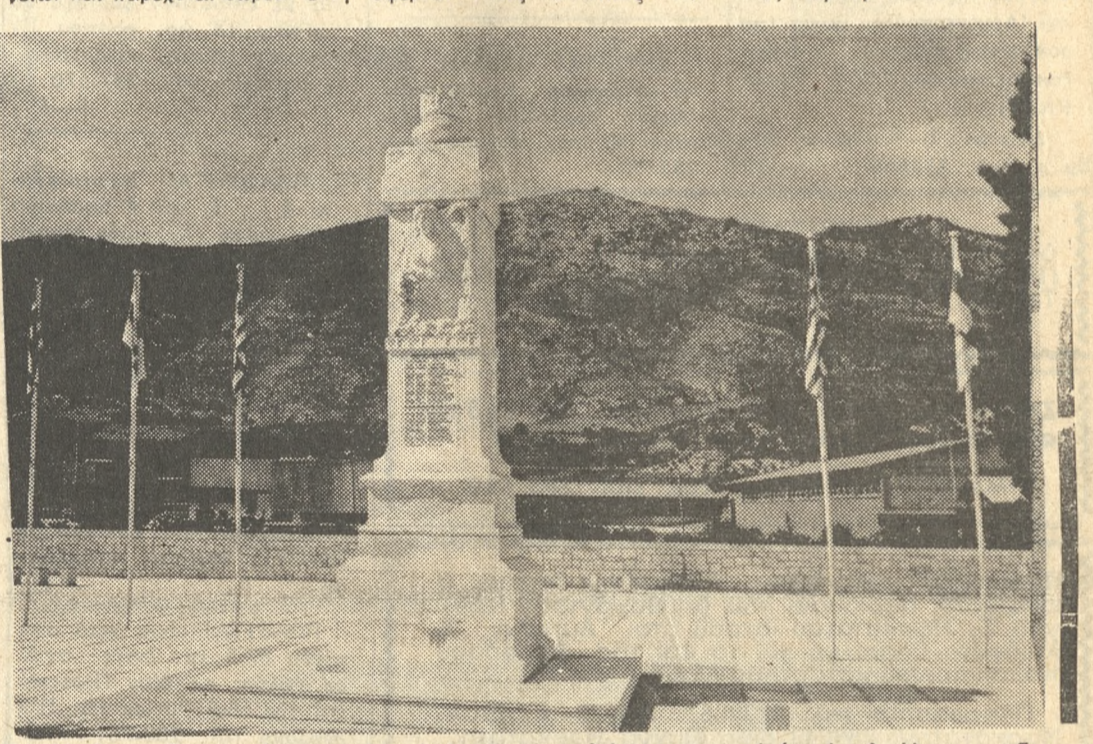
Τό Ηρώον των πεσόντων είς τό όποιον φυλάσσονται τά τρία λείψανα των Αρχανιωτών πού πολέμησαν είς τό διαφόρους άπελευθερωτικούς άγώνες