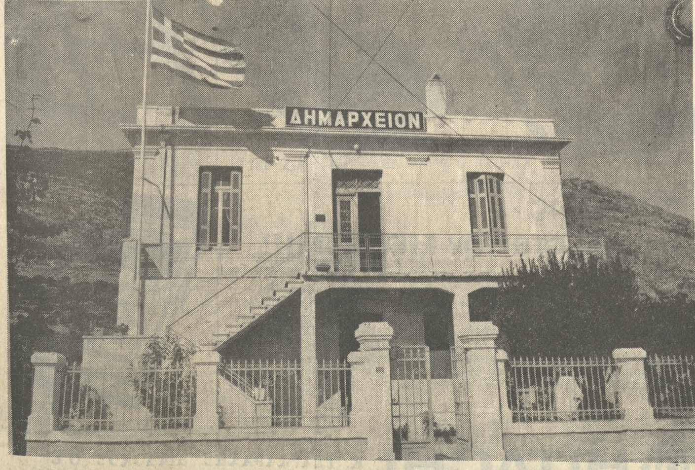
ΤΟ ΔΗΜΑΡΧΕΙΟΝ ΑΡΧΑΝΩΝ

Τά λυματα και τά άπόβλητα των έλαιωτριβείων δεν συνιστούν σοβαρόν πρόβλημα, διό