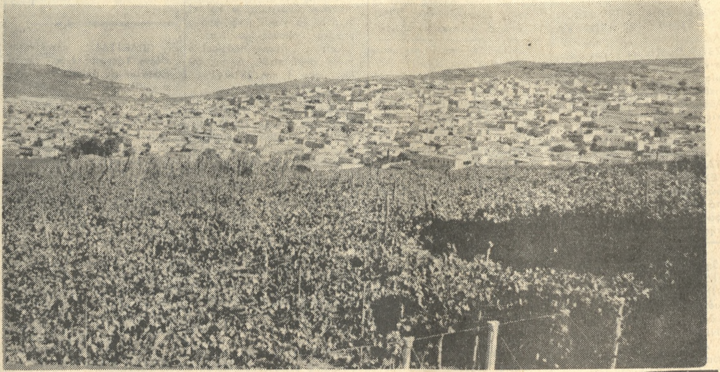
ΓΕΝΙΚΗ ΑΠΟΨΙΣ ΤΩΝ ΑΡΧΑΝΩΝ