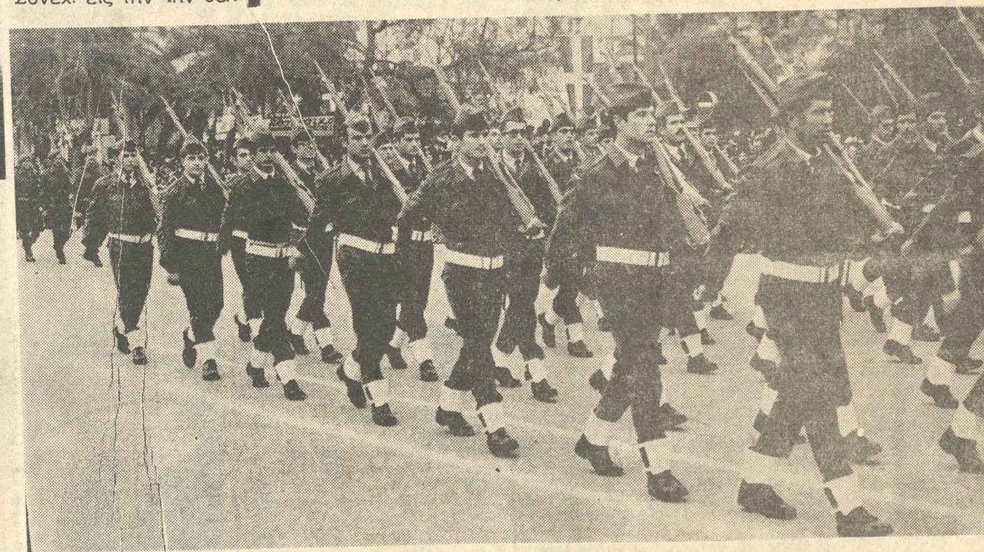
Σμνίτες τῆς 126ης Σμνηρχίας παρελαύνουν πρό τῶν ἐπισημῶν μετὰ ἀψογῶδες οὐρανόμαζον.