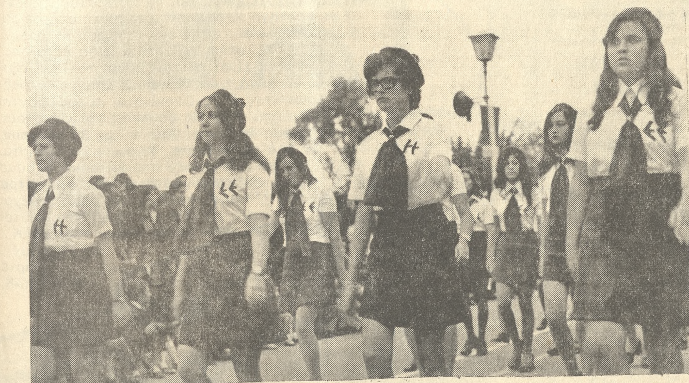
Κοπέλλες τῆς Ἑργατικῆς Ἑστίας — τὰ κορίτσια τοῦ μόχθου — λεβεντόκορμες παρελαύνουν πρό τῶν ἐπισημῶν.