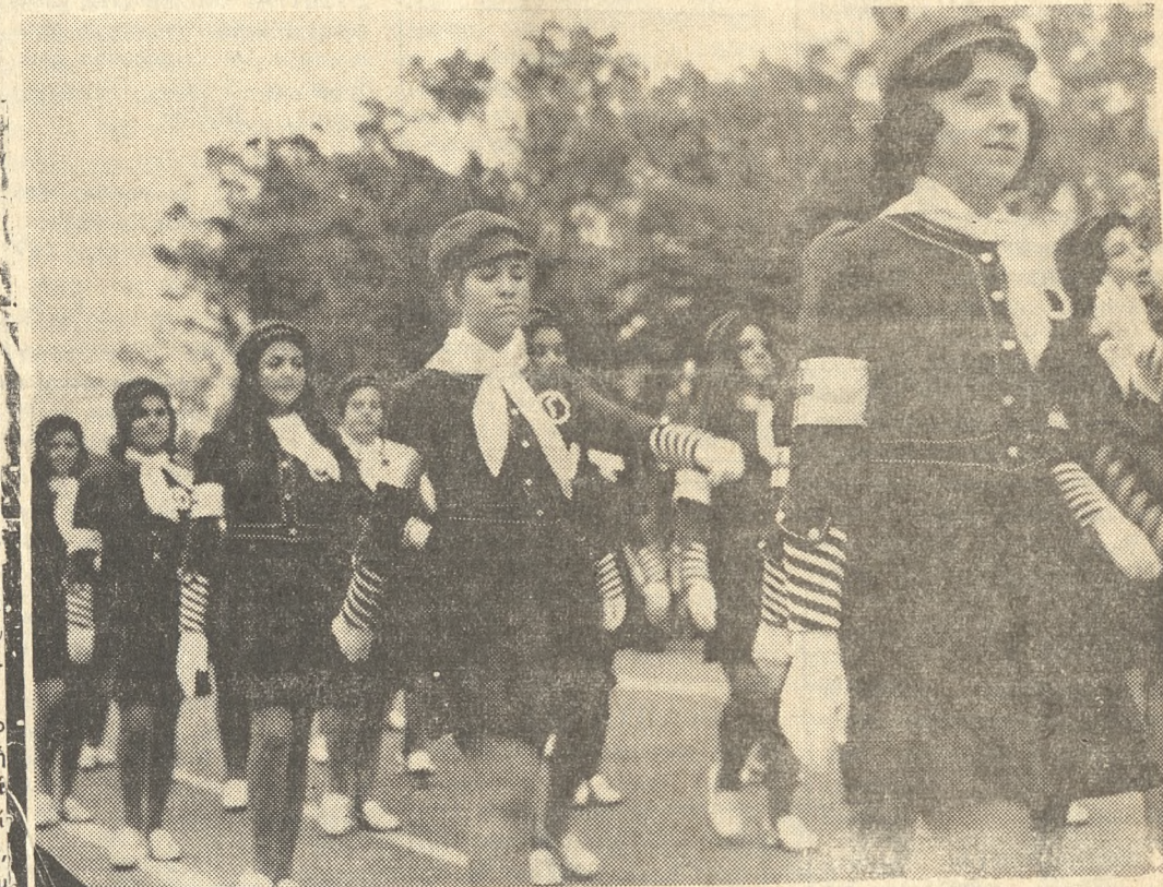
Χαριτωμένες καὶ λιγερόκορμες οἱ Ἐρυθροσταυρίτισσες τοῦ Γ' Γυμνασίου Θηλέων ἐθαυμάσθησαν μετὰ τὰς ὁμοιομόρφους στολάς τῶν καὶ τὴν ἄψογον διελευσίαν τῶν πρό τῶν ἐπισημῶν.