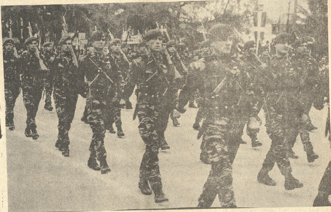
Ἡ ὁμοιομορφία τῶν ΛΟΚ ἡ ὁποία ἐντυπωσίασεν τὸ πλῆθος μετὰ τὴν ἐμφάνισιν τῆς καὶ τὸν «ἰδιότροπον» δημαγωγικὸν τῶν ἀνδρῶν τῆς.

Ἀκολουθεῖ παρήλασις οἱ μαθηταὶ καὶ αἱ μαθήτριά τῶν Δημοτικῶν Σχολείων τῆς πόλεως καὶ τῶν προαστίων, τὸ Ὀρφανοτροφεῖον Θηλέων, ἡ Σχολὴ Ἑργαζομένου Κοριττοῦ, ἡ Σχολὴ Ἑργαζομένου Ἰδρυματῶν καὶ μαθηταὶ τῶν Δημοτικῶν καὶ Ἑργατικῶν Τεχνικῶν Σχολῶν, τὰ Δημόσια καὶ Ἰδιωτικά Γυμνάσια, Ὀδηγοί, Πρόσκοποι, Λυκόπουλα, Ἀλκιμοί, Σπουδαῖοι, Συνέχ. εἰς τὴν ἄψογον διε-