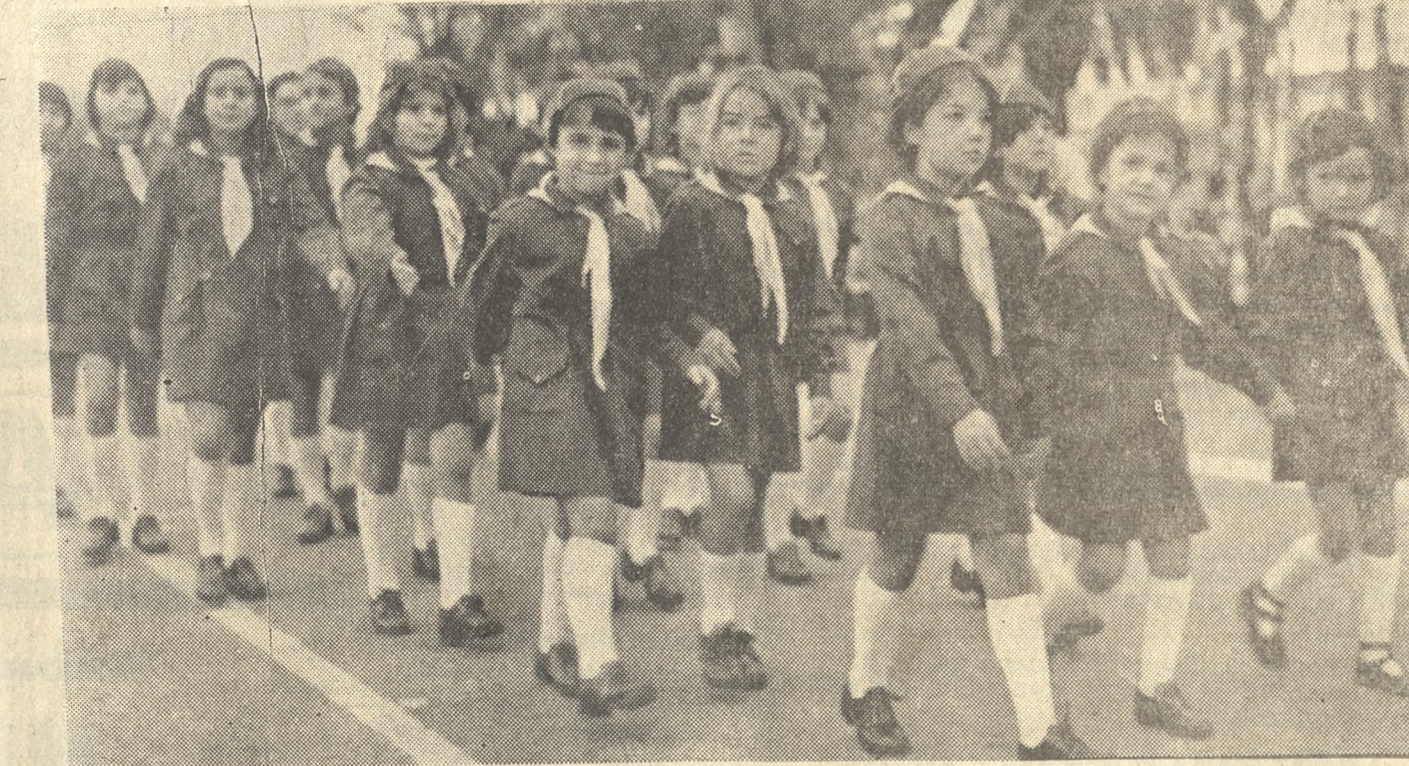
Χαριτωμένα τὰ Πουλᾶκια ἔκαναν καὶ πάλι ἐντὸς τῆς παρουσίας τῶν ἐπισημῶν τὴν ἐμφάνισιν καὶ ἀπέσπασαν τὰ θερμὰ συγχαρητήρια τοῦ πλῆθους.