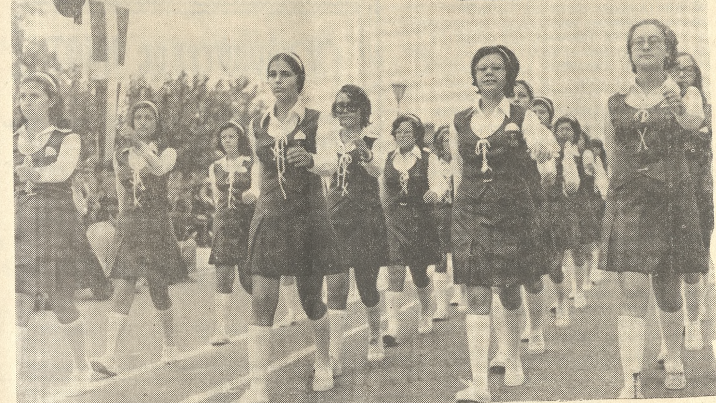
Μαθήτριά του Γ' Γυμνασίου Θηλέων Ἡρακλείου με ὁμοιομόρφους στολάς καὶ ὠραῖον παράστημα παρελαύνουσα πρό τῶν ἐπισημῶν.