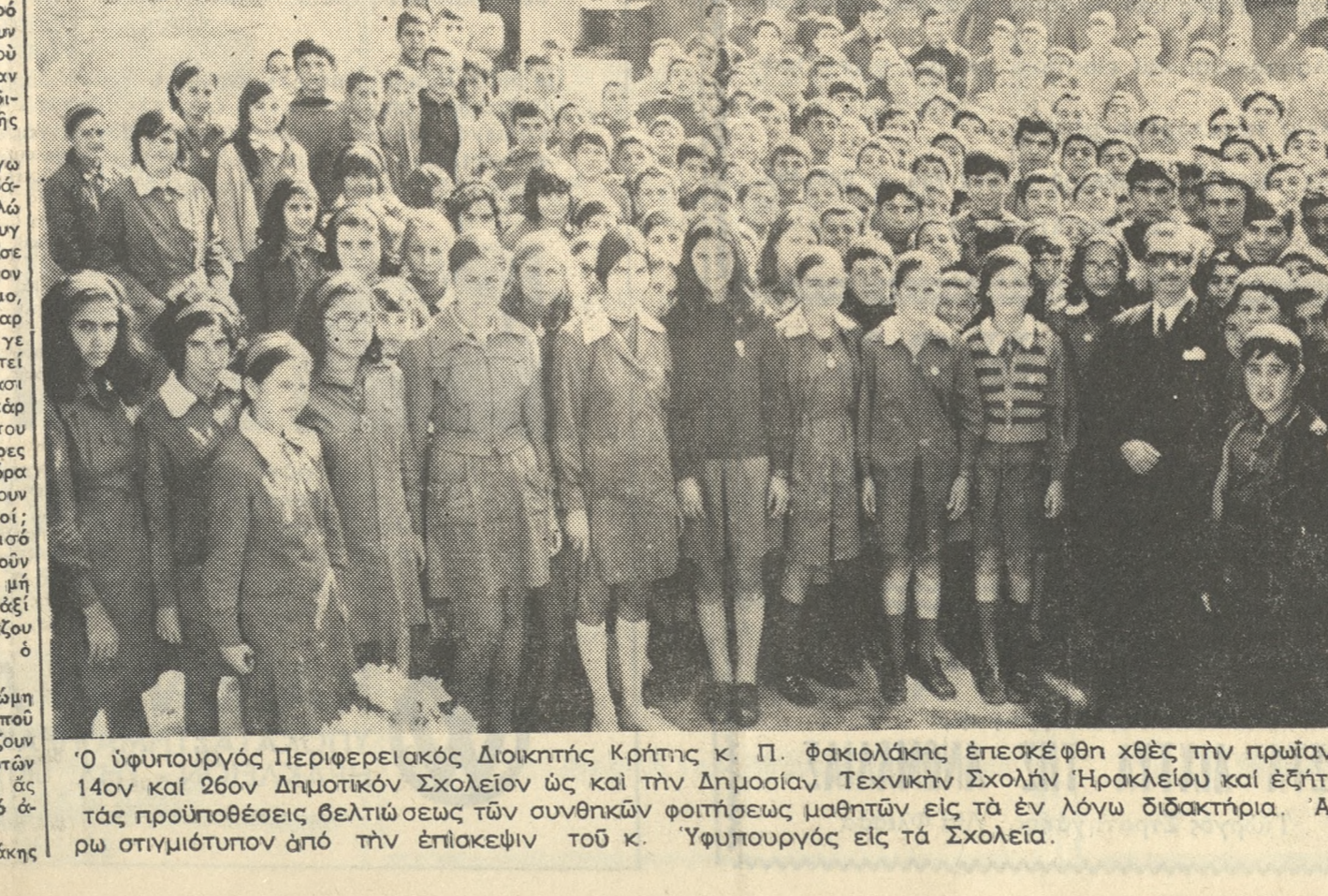
'Ο ύφυπουργός Περιφερειακός Διοικητής Κρήτης κ. Π. Φακιολάκης έπισκέφθη χθές τών πρωίαν τού 14ου και 26ου Δημοτικών Σχολείων εις και τήν Δημοσίαν Τεχνικήν Σχολήν 'Ηρακλείου και εξέτασεν τάς προπρόθεσεις δελτιώσεως τών συνθηκών φοιτήσεως μαθητών εις τά έν λόγω διδαστήρια. 'Ανωτέρω στιγμιότυπον από τήν έπίσκεψιν του κ. 'Υφυπουργού εις τά Σχολεία.