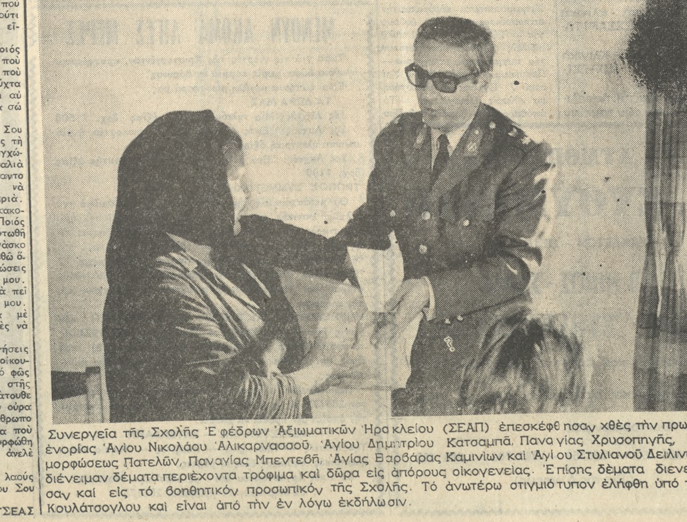
Συμμετοχή της Σχολής Έφείδρων Αξίωματικών Ηρακλείου (ΣΕΑΠ) έπεσκέφθησαν χθές τήν πρωίαν τάς ένορίας Αγίου Νικολάου Άλικαρνασσού, Αγίου Δημητρίου Καταμαύ, Παναγίας Χρυσουπηγής, Μεταμορφώσεως Πατελών, Παναγίας Μπεντεβή, Αγίας Βαρβάρας Καμινίων και Αγίου Στυλιανού Δελινών και διένειμαν δέματα περιέχοντα τρόφιμα και δώρα εις άπόρους οικογενείας. Έπίσης δέματα διενεμήθησαν και εις τό δοσηπτικόν προωπικόν της Σχολής. Τό άνωτέρω στιγμιότυπον έλήφθη υπό του κ. Κουλάτσουλου και είναι από τήν έν λόγω έκδήλωση.