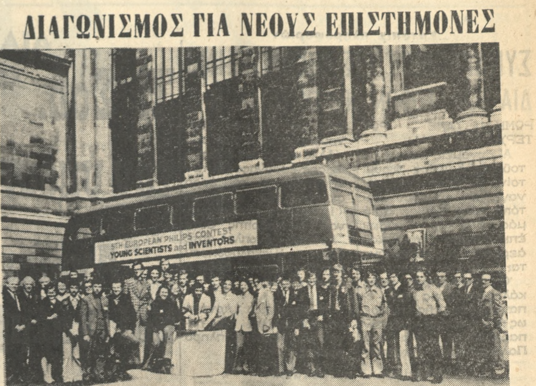
Όμοδική φωτογραφία νέων άπ' όλην Εύρώπη που έλαβαν μέρος στον περυσινό Πανευρωπαϊκό Διαγωνισμό μπουροά από το Μουσείο Επιστημών του Λονδίνου

ΜΕΣΙΤΙΚΟΝ ΓΡΑΦΕΙΟΝ Γ. ΠΑΤΕΡΑΚΗΣ Λ. Καλοκαιρινού 227 Τηλέφωνον 222540 ΠΩΛΟΥΝΤΑΙ οικόπεδα τών 100μ2 200μ2 300μ2 Έπίσης μονοκατοικία διαμερίσματα καταστήματα άγροκτήματα πέσσης φύσεως. Παραθαλάσσια έκτάσεις.