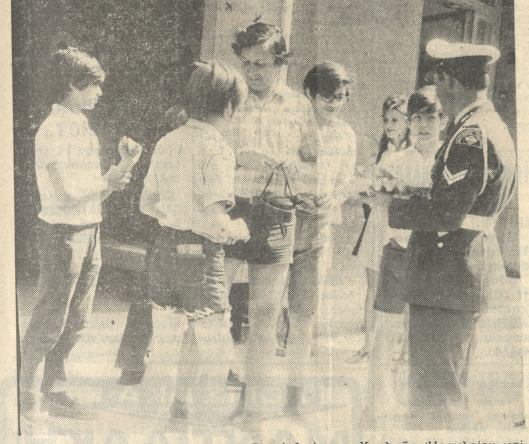
Πλουσίαν κοινωνικήν δράσιν ανέπτυξεν ή Διοίκηση Χωρ) κής Ηρακλείου και κατά το παρελθόν έτος 1973. Εις την φωτογραφίαν μ'ας τροχονόμος διδίδει κοίκα ενά αὐγιά εις τουρίστας,τά οποία και τουσχυρίζεται μαζί τους.