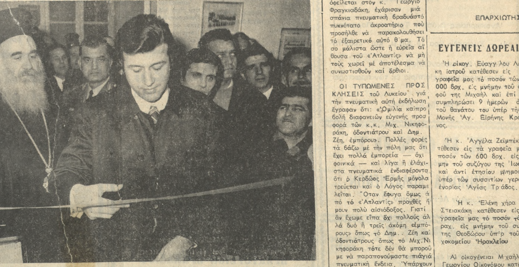
Ὁ Γενικός Γραμματεὺς Νεότητος καὶ Ἀθλητισμοῦ κ. Ἀναστ. Πρίντζης κόβει τὴν καθιερωμένην ταινίαν ἐγκαίνια τῶν ἰδιοκτῆτων κτιρίων τῆς Ἐνώσεως Ποδοσφαιρικῶν Σωματείων Ἡρακλείου — Λασιθίου. Δικαίωμα τῆς Σελ. Ἀρχιεπισκόπου Κρήτης κ. Εὐγένιος ὁ Νομάρχης κ. Μασούρος καὶ ὁ ΣΔΗ Ταξίαρχος κ. Λινάρδος.