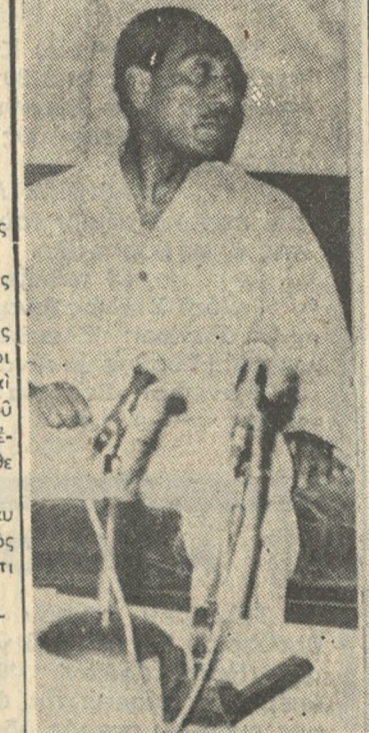
Ο ΠΡΟΕΔΡΟΣ ΣΑΝΤΑΤ

Ο ΣΑΝΤΑ ΘΑ ΕΠΙΣΚΕΦΘῆ ΤΗΝ ΓΑΛΛΙΑΝ ΚΑ' Ι'ΡΟΝ 15 Η έφημερίς Άχράμ γράφει σήμερα ότι ο Πρόεδρος τής Αίγυπτου Σαντάθ θά έπισκεφθῆ τήν Γαλλίαν.