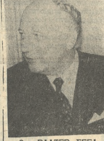
Ο κ. ΒΑΛΤΕΡ ΣΕΕΛ

Ό κ. Σέελ εδήλωσεν εις τήν λοιπήν συνέντευξιν ότι κατά τήν διάσκεψιν τής Ουάσιγκτων ήπρεπε να γίνη προσπάθεια και ταρτίσεως Εύρωπαϊκού ένεργειακού προγράμματος έν σπουδή. Ό κ. Σέελ έπλεν ότι έξ αιτίας πολλών Γαλλικών έπιφυλάξεων έναντί τής προτεινομένης κοινής πολιτικής δέν κατάστη δυνατή η έπίτευξις συμφωνίας έφ' όλων τών υπό συζήτησιν σημείων. Ό Γερμανός ύπουργός έπλεν έπίσης ότι τούτο πρόκειται να έχη έπιπτώσεις επί τών σχέσεων μεταξύ τών έταίρων τής Κοινής Άγοράς.