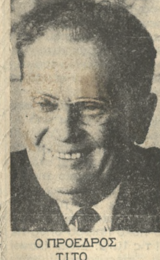
Ο ΠΡΟΕΔΡΟΣ ΤΙΤΟ

Τό Βελιγράδιον έπιδείκνεται τάρω όπως έπιτύχη τήν χορήγησιν ποσού 254 εκατομμυρίων δολαρίων υπό μορφήν Γερμανικών επενδύσεων εις Γιουγκοσλαβίαν.