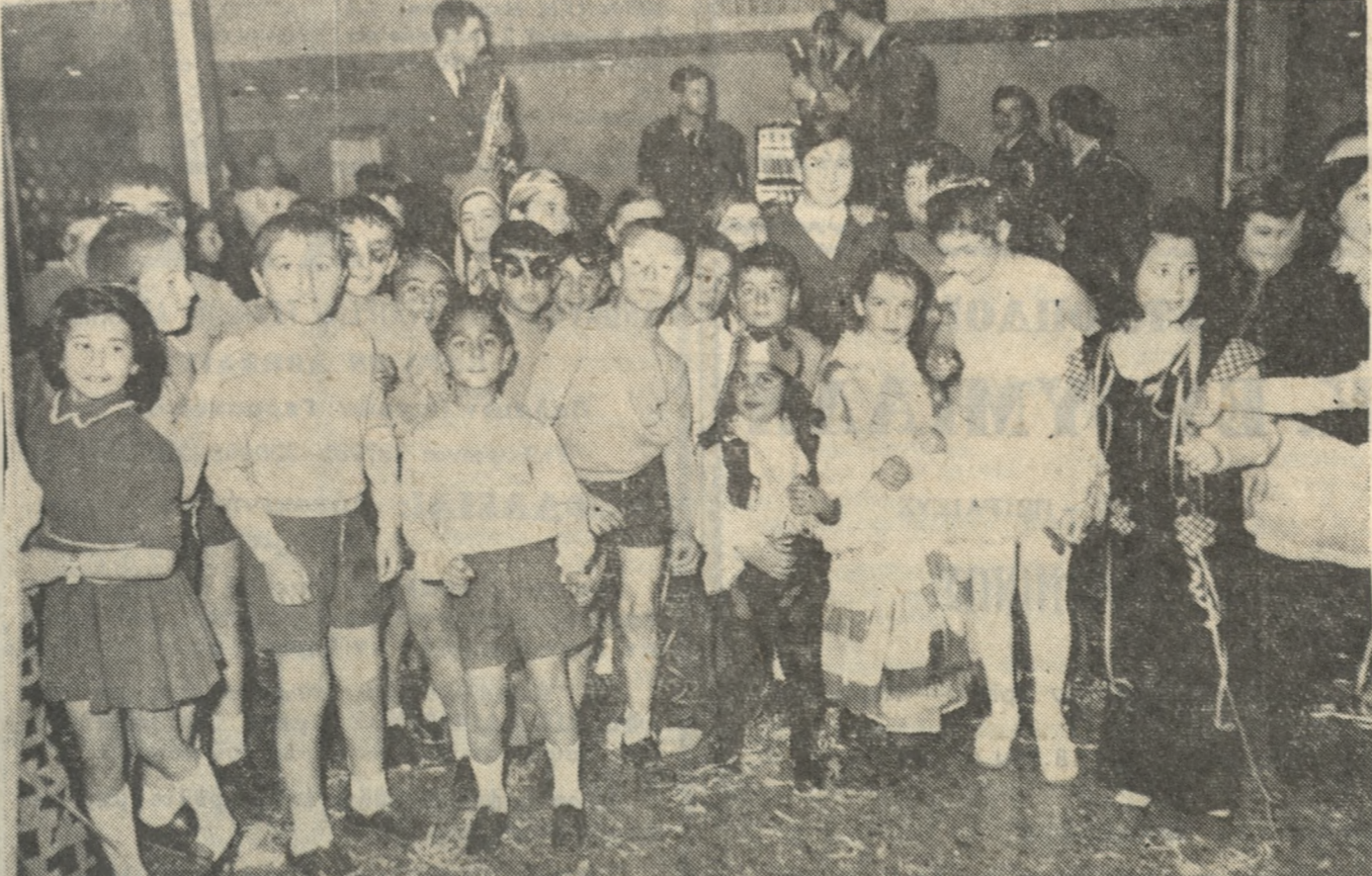
Επιτυχία έσημείωσε ο παιδικός αποκριτικός χορός του Πιτσουλακειού Ιδρύματος ο όποιος έδóθη χθές τό άπόγευμα εις την αίθυσαν Άριάδνην του ξενοδοχείου Άστώρια. Κατά την διάρκειαν του χορού έπαίξαν, ευγενώς προσφερθείσιν οι όρχήστρα της ΣΕΑΠ. Άνωτέρω μερικαι μάσκαράδες και μη συγκεντρωμέναι έκείτρον εις τόν φωτογραφικό φακό.