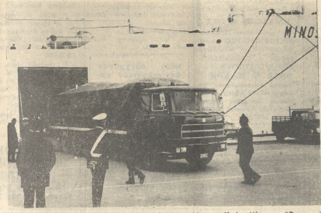
Ένα φορτηγό «βγαίνει» από τον «εμπορικό» του Φέρυ-Μπώτ «Μίνω». Όπως αυτό κατά το παρελθόν έτος 1973 εξεφορτώθησαν εις τον λιμένα μας 21.771.