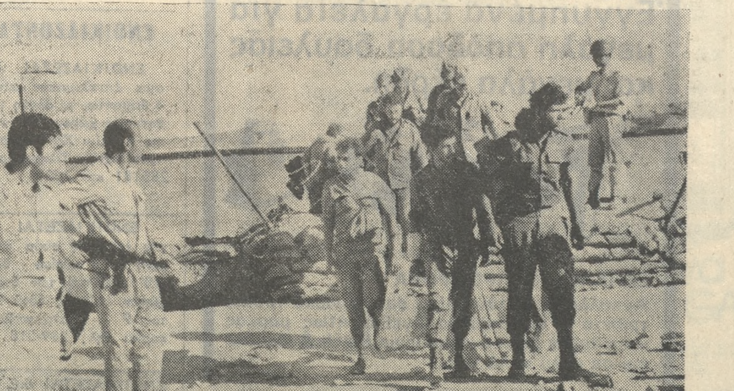
Ο Σαντάτ γιά πρώτη φορά έδωσε τήν χαρά στους Αιγυπτίους να δούν 'Ισραηλινούς στρατιώτες αιχμαλώτους. Στην φωτογραφία ένα τέτοιο στιγμιότυπο από τόν πόλεμο τού Οκτωβρίου. 'Ισραηλινοί αιχμαλώτοι των Αιγυπτιακών δυνάμεων

Εκτίθεται εις επαναληπτικόν δημόσιον τακτικόν μεσοδικόν διαγωνισμόν δι' έγγραφον και έσφοργισίτων προσφορών η προμήθεια 50 (2) κιλότων (προσποστικόν) θαλάσμων με ψέβιν. Ο διαγωνισμός δενεργήθη σται τήν 30ην Απριλίου 1974 ήμεραν Τρίτην και άραν 12ην π.μ λήξει καταθέσεως προσφορών) ενόπιον τής μονιμου έπιτροπής προμηθειών τού Σταθμού 'Εγγυήσεως συμμετοχής εις τόν διαγωνισμόν τση πρς πέντε τοίς εκατό (5%) επί τής συνολικής αξίας. Τά έξοδα δημοσιεύσεως άμφοτέρων των διαγωνισμών θα βαρύνουν τόν τελευταίον μειοδότην. Πλείονες πληροφορίες παρέρχονται εις τή γραφεία τού Στάθμου Κνωσού 1, τηλέφωνον 282716 κατά τας έργασίμους ήμέρας και ώρας. Έν Ηρακλείω τή 10 Απριλίου 1974. Ο Διότης τού ΣΕΠΦΗ Ι. ΧΑΡΔΑΚΗΣ