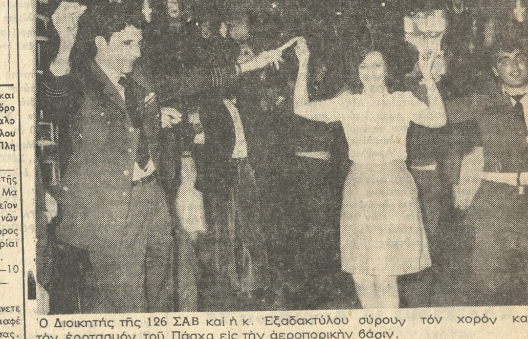
Ο Διοικητής τής 126 ΣΑΒ και ή κ. "Εξαδακτύλου αύρουγ τόν χορόν κατά τόν έορτασμόν του Πάσχα εις τήν αεροπορικήν βάση.