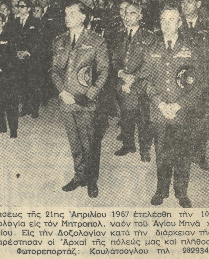
Ἐπὶ τῆ συμπληρώσει 7 ἐτῶν ἀπὸ τῆς Ἐπαναστάσεως τῆς 21ης Ἀπριλίου 1967 ἐτελέσθη τὴν 10.30 πρῶτιν τῆς προχθῆς Κυριακῆς ἐπισημὸς Δοξολογία ἐν τῷ Μητροπολί- τῶν τοῦ Σεβ. Ἀρχιεπισκόπου κ. Ευγενίου. Εἰς τὴν Δοξολογίαν κατὰ τὴν διάρκειαν τῆς ὁ- ποίας ἐλήθη καὶ τὸ ἀνωτέρω σινιμιότυπον παρέστησαν οἱ Ἀρχαὶ τῆς πόλεως μας καὶ πλῆθος κό-