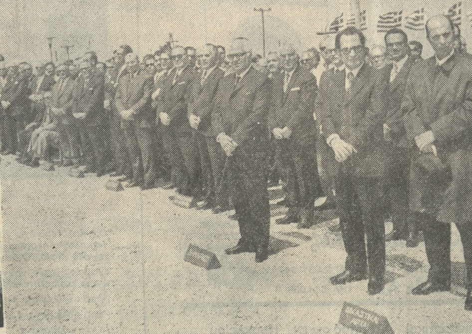
Οι έπίσημοι τό τόπου κα τά τήν διάρκειαν τής τελετής ή όποια έλαβε χώραν χθές τήν πρωίαν εις τό Στρατόπεδον Δασκαλογιάννη (Σ.Ε.Α.Π.) επί τή έορτή του Προστάτου του Στρατού μας Άγ. Γεωργίου.