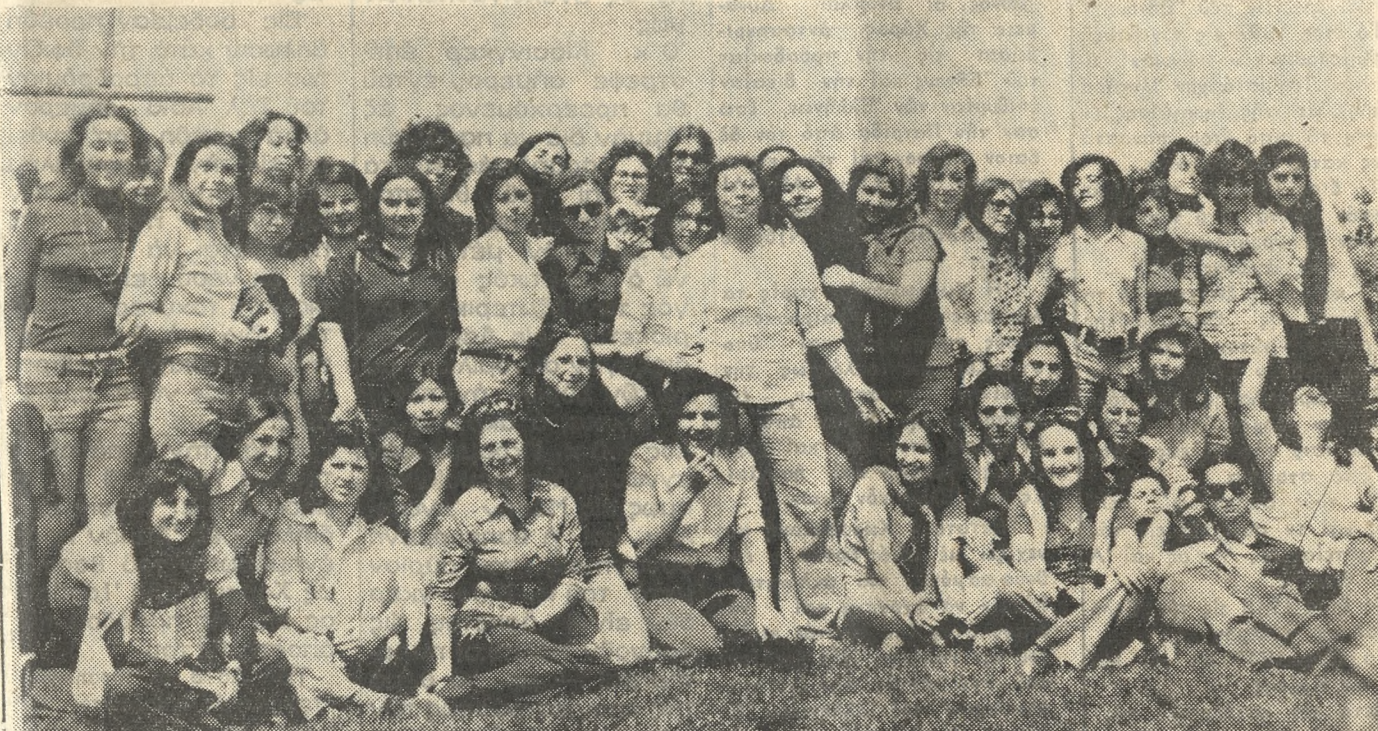
Έκδρομείς μαθήτριά το Β' Γυμνασίου Θηλέων Κολωνακίου Αθηνών έπισκέφθησαν χθές τον τάφον του Καζαντζάκη όπου και άπεθανάτισε την έπίσκεψιν ό φακός του φωτορεπόρτερ Ν. ΜΑΛΤΕΖΑΚΗ τηλ. 281.396.