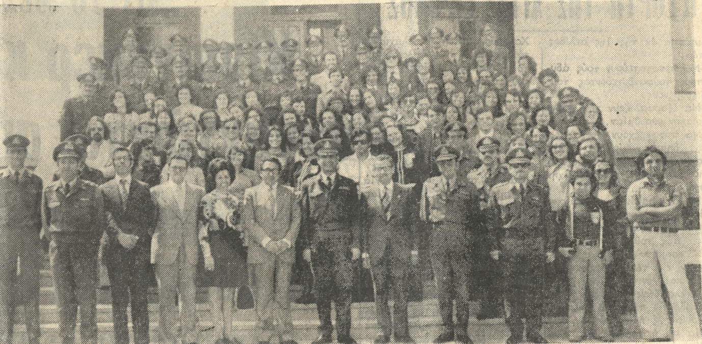
Οι σπουδασταί της Παντείου Σχολής που βρίσκονται από ήμερών στο 'Ηράκλειο έπισκέφθησαν προχθές Κυριακήν την ΣΕΑΠ όπου άντλήλαξαν με τον ύποδιοικητήν της Σχολής άναμνηστικά δώρα. Άνωτέρω Καθηγηταί και Σπουδασταί φωτογραφίζονται με άξιωματικούς και μεθ' ός της Σχολής.