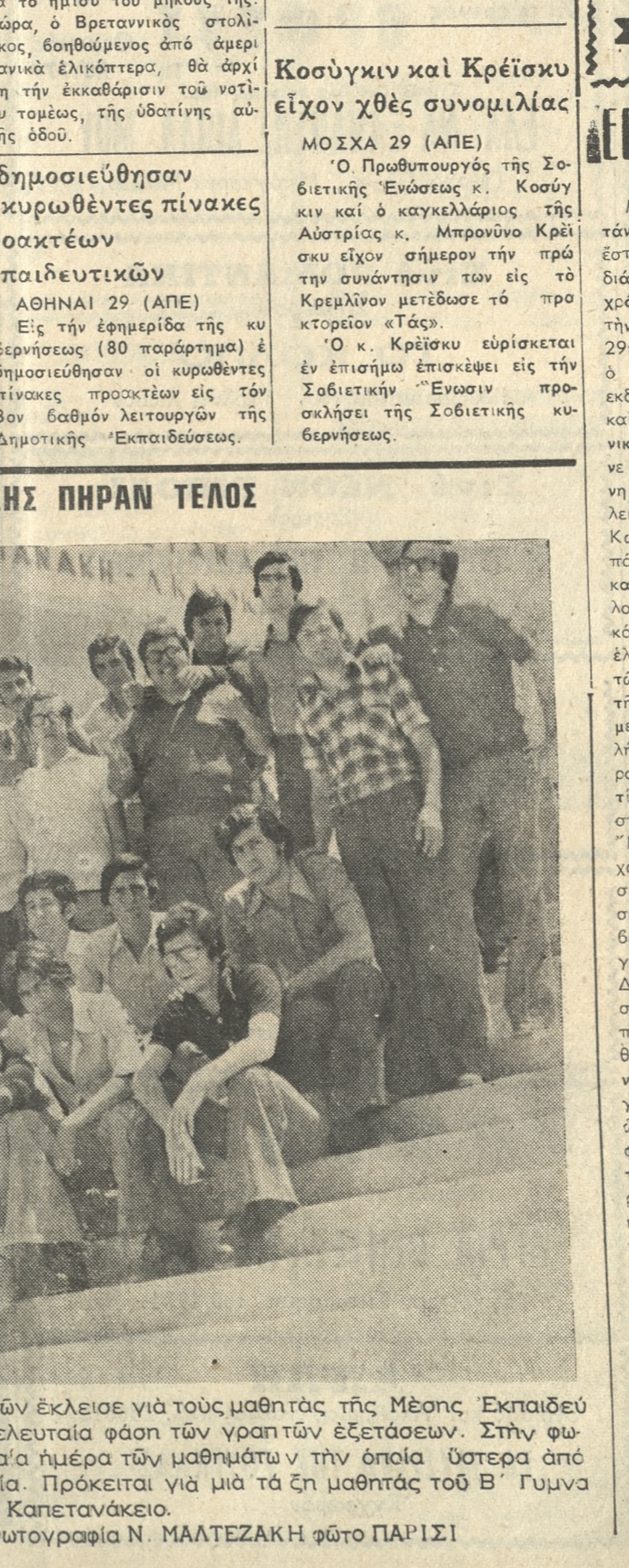
Τά μαθήματα ήπραν τέλος. Άλλος ένας κύκλος σπουδών έκλεισε για τούς μαθητάς τής Μέσης Έκπαιδευσεως που παίρνον σήμερα τό πρόγραμμα για τήν τελευταία φάσιν των γραπτών εξετάσεων. Στην φωτογραφία ένα ένστονταν από τήν χθεσινήν τελευταία ήμέρα των μαθημάτων ν τήν οποία ύστερα από χρονία τά σμερνά παιδιά θα θυμωθούν με νωσταλία. Πρόκειται για μία τάξη μαθητάς του Β' Γυμνασίου Άρρένων μέ έναν από τούς καθηγητάς των στω Καπετανάκιο.