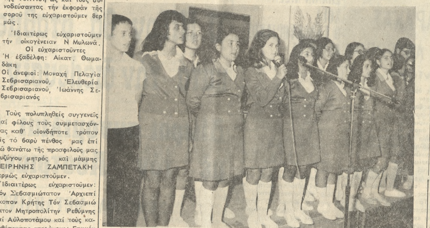
Φωτογραφικόν στιγμιότυπον από τήν εκδήλωσιν ή οποία έλαβε χώραν τήν Κυριακήν εις τό Οικονομικόν Γυμνάσιον 'Ηρακλείου. 'Ανω αί μαθήτρια τής χορωδίας αί οποίαί έτραγούδισαν μέ έπιτυχίαν διάφορα τραγούδια.

ΜΠΟΥΤΙΚ "MARTINE," Χαριτωμένα νεανικά μοντέλα για τίς σουπερ-μοντέρνες κοπέλλες. Και μοντέλα 'ΣΤΡΙΚΙΓΚ,, ΜΠΟΥΤΙΚ "MARTINE," Καλλονάδων 14 (πάροδος 'Εβανς)