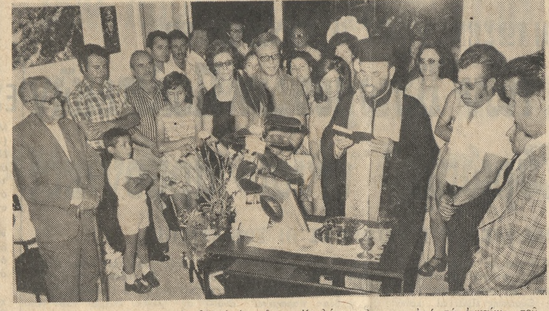
Φωτογραφικόν στιγμιότυπον από τά εγκαινία του νέου παρά την πλατεία Ρήγυφραίου καλλιτεχνικού φωτογραφείου των κκ. Μ. Άνδριώτη και Μ. Μελιώτη. Τό νέο αυτόφωτογραφείον διαβ' τετρί και μίαν πλουσίαν συλλογήν νυμφικών φορεμάτων και δώρων διά γάμους και βαπτίσεις.

ΕΝΟΙΚΙΑΖΕΤΑΙ τό παρά την Λεωφόρον Καλοκαιριού 74 Κατάστημα ύφασμάτων Δημ. Τζέρμμη τηλ. 283251