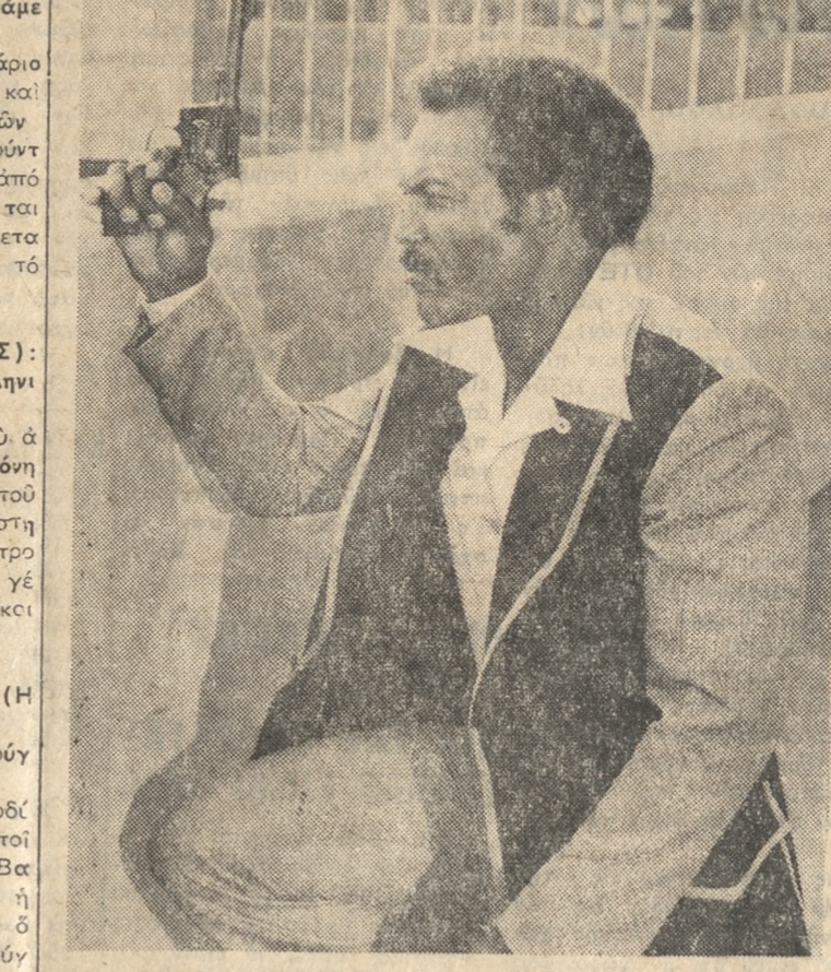
Ο Τζιμ Μπράουν σὲ μιὰ σκηνὴ τῆς ἐγχρωμῆς περιπέτειας «Σφαγὴ στὴ Λέσχη τοῦ Χόλυγουντ».

ΜΙΑ καταπληκτικὴ ταινία δεσπόζει στὸ δεύτερο μέρος τῆς ἐβδομάδος αὐτῆς. Πρόκειται γιὰ μιὰ ἀριστουργηματικὴ δημιουργία τοῦ Τσάρλι Τσάπλιν ἡ οποία περιέχει ἕνα μῆνυμα ἐπικαιροῦ. Ἐνα μῆνυμα πού μπορεῖ νὰ ἐκπνεύεται ὅσο ὑπάρχουν ἀκόμη ἄνθρωποι πού μποροῦν ν' ἀκούν, νὰ νοιώθουν καὶ νὰ βλέπουν.