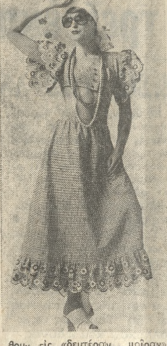
Θυνη εις «εύτερον μοίρον». Οι δημουργοί μάδας θέλουν νά κερδίσουν τής πολλή νεαρές κοπέλλες με τής κομψές «κρεσσάσιον» που παρουσιάζουν. Φορεδιά φορέματα τό μακρόν τέσσερα δάκτυλα τουλάχιστον κά τω άπ' τό γόνατο από ύψοςμα τή πολλή λεπτά. Η «κουριέρ» Τόνι Σίσσερ π.χ. που είναι γνωστή και εις τό εξωτερικό διευκολύνει τής γυναίκες νά ντύνται κομψά και τά μοντέλα τής άρτισάν ίδια πέρας. Αύτη προτιμά ύψοςμα μπροσύτερι και «καταμαρσιμέναν» λι νά ύψοςμα άς και σιφόν ζαρέτ και κρέπ ντε σίν. Εις τήν φωτογραφία: ένα γενικό -ρομαντικό φόρεμα γιά τό καλοκαίρι από μπροντέρ - μοδερνιά μα μπουκέτα από λουλουδία σέ άποχρώσεις πορτοκαλί χρώματος.

ΟΙ ΕΙΔΙΚΟΙ πρεσβεύουν ότι τά φορέματα θα έχουν «τόν κύριον λόγον» εις τήν θερινήν σαζόν ενά εξ άλλου τά μεγάλα υτεκλιτέ θα αποτελούν τό «οπτικόν σημείον» άκόμα και σέ άπογευματινά φορέματα οι... γάμπες δε θα έρ-