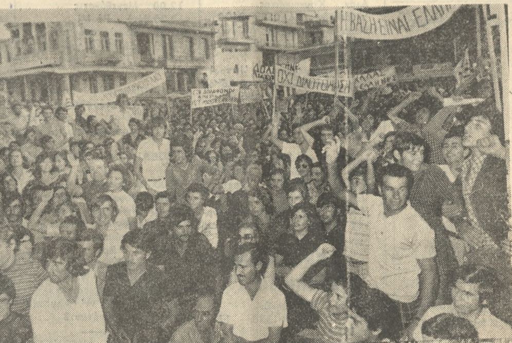
Ακράττος ήτο ο ένθουσιασμός τής Νεολαίας μās.

καί τό καταλυμένο δικτατορικό καθεστòς. Αυτοί άνάσχουν τά επρόδοσαν καί ξεπολίτησαν τήν έθνικήν ύπέρειαν τής Κύπρου στά ξ'να συμπεφροντα. Γι' αύτό ΖΗΤΟΥΜΕ τήν πασα δειγματική τιμωρία τους ως προδοτών.