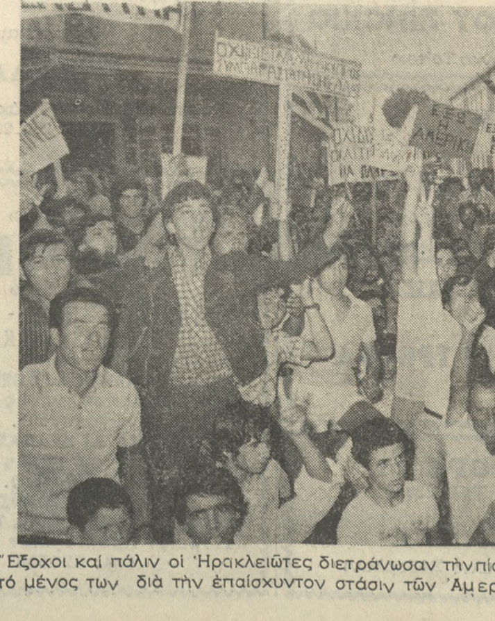
Έξοχοι καί πάλιν οι 'Ηρακλειώτες διετρανώσαν τήν πίστην των προς τά Έθνικά ιδεώδη καί έξεδύλωσαν τό μένος των διά τήν έπαίσιχονταν στάσιν των Άμερικανών στήν τραγωδία τής Κύπρου.

6) ΣΤΕΚΟΜΑΣΤΕ άγωνιστικά στό πλεύρο των αδελφών μās Κυπρίων καί στρέφω