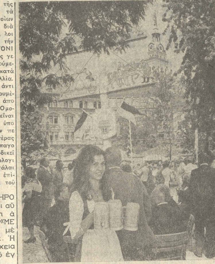
ΜΟΝΑΧΟΝ — Οι ύπαίθριες μπυραρίες εις τό Μόνα

χον όπου ή ευχάριστη είναι ευχάριστη και έπικρα- τεί εύθυμια καθίστανται διαρκώς περισσότερο προ- φιλείς. Έφ'ετος εγκαινιάσθησαν ες άλλου πεντε νε ες 'υπαίθριες όασεις (υποπόσιος). Πρόκειται δε συντόμως να ανοίξουν και άλλες νέες ύπαίθριες μπυραρίες. Παρ' όλας τας άντιρρήσεις που ύπαρ- χουν εξακολουθεί να παραμένει τοιούτοτρόπος εν από τά κυρίως θελγντρα του Μοναχου τσόν δια- τούς κατοίκους όσον και διά τους επισκεπτας ή κα- τάλυσις (στην ύπαίθρια μπυραρία με όλη την οικο- γένεια) κάτω από τόν ίσκιον των δένδρων καστανι ας και τών ... έσωτερική δροσιά τις ζεστές μέρες του καλοκαιριού. Τά τελευταία χρόνια πολλές μπυ ραρίες εις τό κέντρο της πόλεως παρ' όλων, να εκλείθων προκειμένου νανεγερθών κτίρια. Ο φό θος των (ψιφασμένων) απειδείχεν εν τούτοις τώρα δικαιολόγητον. Ακόμη και ή διοίκωσις της πόλεως ετέθη ύπερ τήσπεραιτέρω διαδόσεως των ύπαίθριων μπυραριών εγκαινιάσει δε εις την άνοράν τροφίμων προσπάθειαν έναν νέον χώρον γιά ζεκούραση (ως ει κονίζεται άνωτέρω) κάτω από τό φύλλωμα 69 άνθι- όμενων καστανιών.