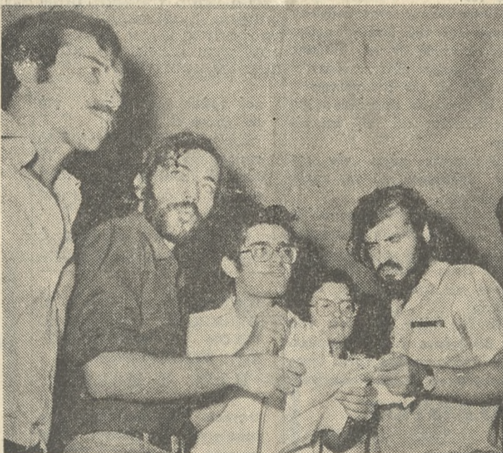
Μέλη τής Έπιτροπής αναφωνούν συνθήματα προς τήν συγκέντρωσιν.

ΦΩΤΟΓΡΑΦΙΚΟΝ ΡΕΠΟΡΤΑΖ ΦΩΤΟΚΟΥΛΑΤΣΟΓΛΟΥ Τηλ. 282934