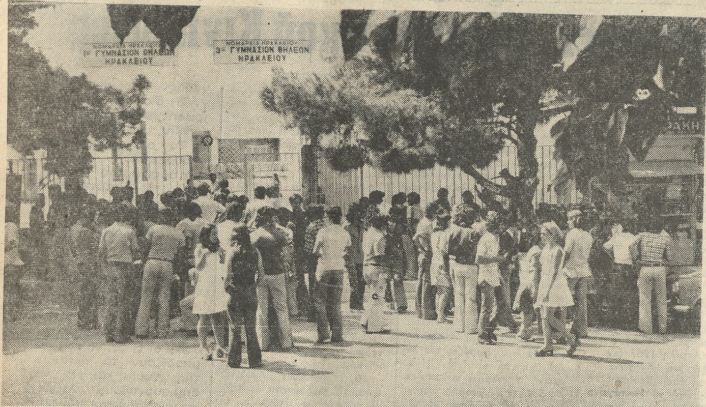
Κορύφωση της ανωνίας για τους υποψηφίους σπουδαστές αυτές οι μέρες των εξετάσεων που ξεφυλλίζεται η μαργαρίτα των γνώσεων με το «θα περάσω ή δεν θα περάσω;». Στη φωτογραφία μας ένα στιγμιότυπο από συγκεντρωμένους υποψηφίους μπροστά στα Γυμνάσια Θηλέων χθες το πρωί και ενώ περιμένουν την ώρα να μπουν για εξετάσεις.