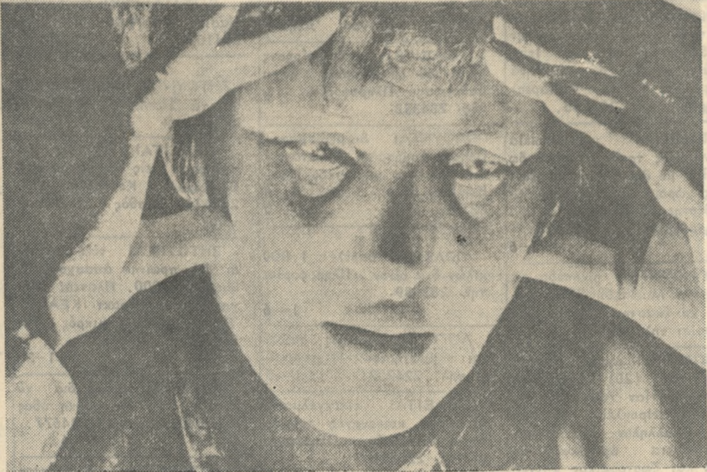
Υποφέρει από νεύρωση. Δεν φταίει αυτός αφού του την έδμηούργησε το περιβάλλον του. Πληρώνει αυτός τα «πασμένα» των άλλων.

Ο ΠΑΤΕΡΑΣ και η μητέρα με τις πράξεις τους με τη συμπεριφορά τους αντιπροσωπεύουν για κάθε παιδί τα πρότυπα που διαλέγει. Τους αντιγράφει λοιπόν σε όλα στην φωνή και στις χειρονομίες στην έκφραση και στις εύκολες συγκινήσεις. Προσαρμόζεται όχι μόνο σε ό τι δικό τους θέλει αλλά και σε αυτά που μένουν κρυμμένα. Γιατί η εικόνα του πατέρα ή της μητέρας αποτελεί ένα είδος «παγόδουνο» που μένει οδωτό μόνο ένα ελάχιστο τμήμα του ενώ το υπόλοιπο σκεπάζεται από τη θάλασσα.