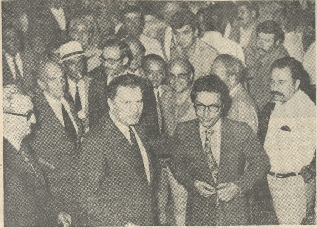
Στιγμιότυπο από την άφιξη του κ. Βενιζέλου στο 'Ηρακλειό. Στην φωτογραφία ό κ. Νικήτας Βενιζέλος και ό έκ των υποψηφίων της ΕΚ-ΝΔ του νομού μας κ. Τηλ. Πλεύρης και πολλοί συμπολίτες.

χώρησε άεροπορικώς χθές το θράδυ δι' Αθήνας προκειμένου σήμερα τον πρωί να συναντηθί μετά του άρχηγού της ΕΚ-ΝΔ κ. Γ. Μαύρου.