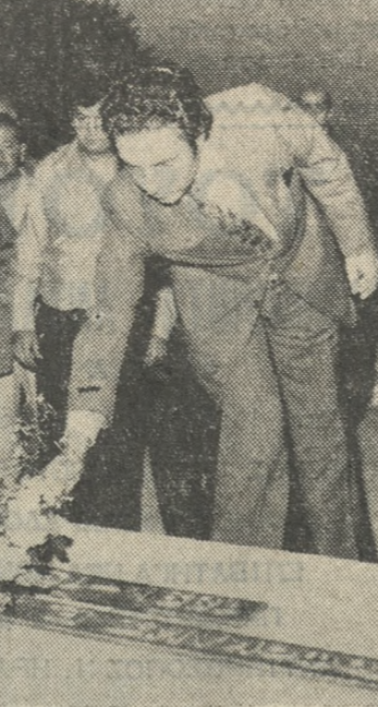
Προχθές Τρίτη ό κ. Ν. Βενιζέλος έπεσε κέφθη το προσκύνημα τους διδόμενος τού 'Ακρωτηρίου και κατέθεσε ό αυτούς λουλούδια. Στη φωτογραφία μας ένα στιγμιότυπο από τό προσκύνημα του στο Ακρωτήρι.