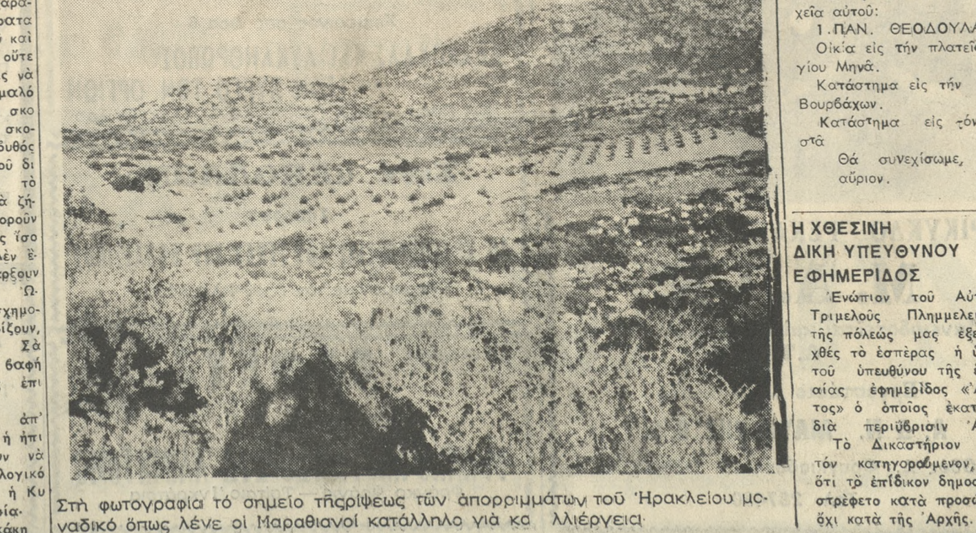
Στή φωτογραφία τό σημείο τήρσιψεως τών απορριμμάτων τού Ηρακλείου μοναδικό όπως λένε οί Μαραθιοί κατάλληλο για καλλιέργειαι.

ΑΙΤΗΣΙΣ ΚΑΙ ΥΠΟΜΝΗΜΑ Άπάντων τών κατοίκων τού χωριού Μαράθου Μαλεβίου. Πρός τόν κ. Ύπουργόν Έσωτερικών και τόν κ. Νομάρχη Ηρακλείου. Δι' άποφάσεως τού Δήμου Ηρακλείου προεκρήθη ως χωρ έναποθέσει τών απορριμμάτων τής πόλεως Ηρακλείου ή τοποθεσία «Αδός» δωρείας τού «Στρατούμωλος» και εϊς τας παρυφάς αυτού εϊς άπάστασιν δέ έπιτακώσαν έντρονον περίπου νοτίως τής