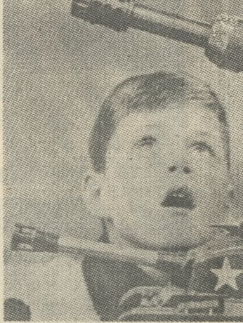
Προσχή η υπαίτιος μεθοδικά και ιουθενικά παιχνίδια...