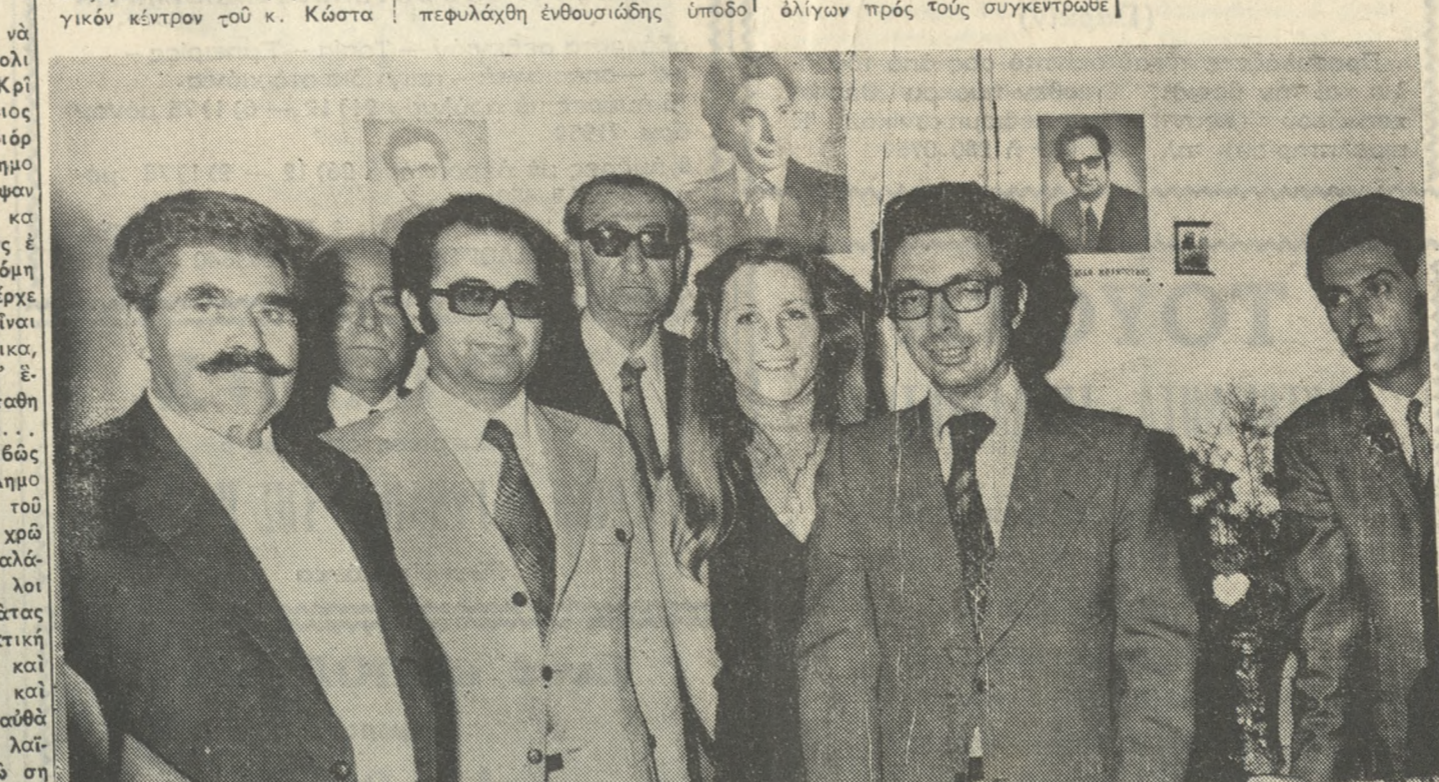
Ο κ. Νικήτας Βενιζέλιος ή συζυγός του, ο κ. Κώστα Μπαντουβάς και ο πατέρας του κ. Γιάννης Μπαντουβάς σε πρώτο κέντρο, φωτογραφούμενοι στο έκλογικό κέντρον του κ. Κώστα Μπαντουβά.

Μπαντουβά, ο όποιος ως γνωστόν είναι ο Διευθυντής του Πολιτικού του γραφείου. Εις τον κ. Ν. Βενιζέλιον έπεφυλάχθη ένθουσιώδης ύποδοχή άπό τά πλήθη που ήταν έξω άπό τά γραφεία του Κέντρον. 'Οκ. Βενιζέλιος μιλήσε δι' όλιγων προς τους συγκεντρωθέντας για τό πρόγραμμα του κόμματος και τους ηύχαρίστησε δια τό ένθουσιασμόν των ως και δια τό φιλελευθεροφρόνημά των.