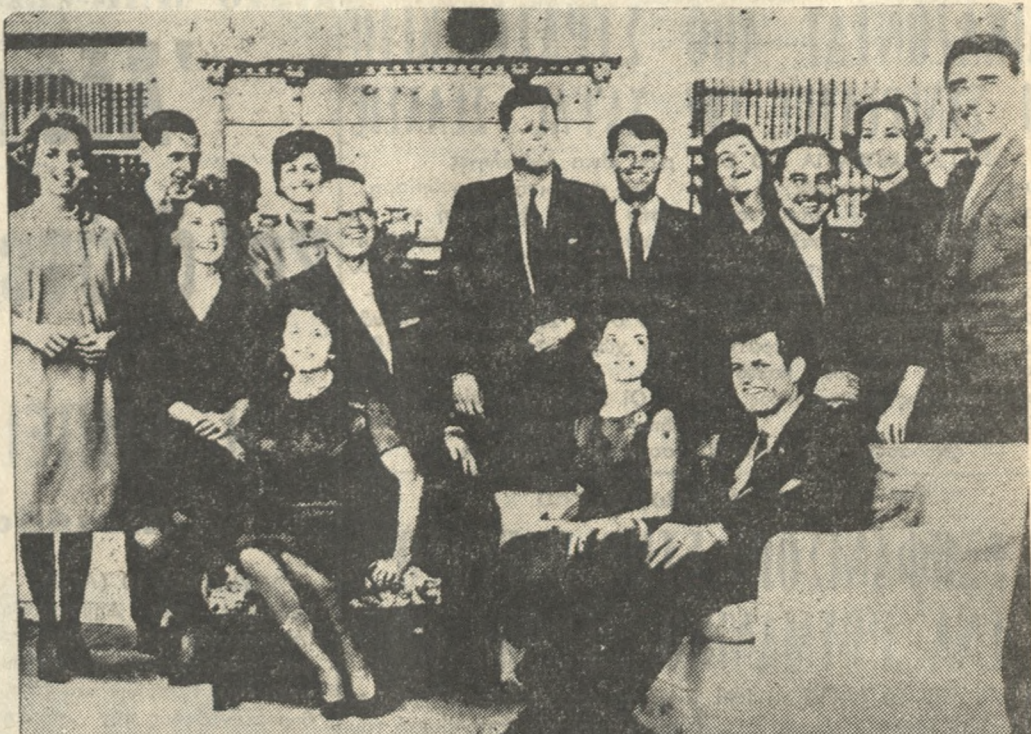
Επί τέλους προβάλλεται στό 'Ηρακλείο ή ταινία όρόσημο του 20ού αιώνοσ