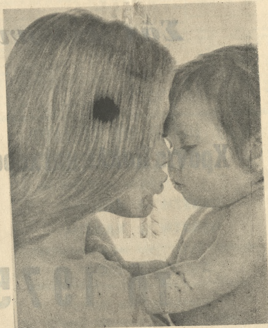
με παιδικές τροφές BEECH - NUT (ΜΠΙΤΣ-ΝΑΤ)

ΕΥΤΥΧΙΣΜΕΝΟΣ Ο ΚΑΙΝΟΥΡΓΙΟΣ ΧΡΟΝΟΣ Καί ευχάριστα γεύματα για τό μωρό σας