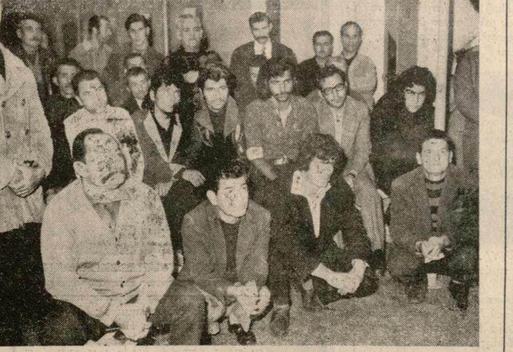
Μιά ομάδα από φυλακισμένους κατά την διάρκεια μιάς από τις εκδηλώσεις που έγιναν στις φυλακές Άλικαρνασού αυτές της μέρας.

ων συνοδευόμενοι από καθηγητές τους και μαθητήρες του Ά' Γυμνασίου Θηλέων συνοδευόμενες από τον καθηγητή κ. Ζερδού μάς έπισκέφτηκαν για να μάς εκδηλώσουν την άγάπη τους. Μάς έβαλαν τά κάλαντα των Χριστουγέννων μάς προσέφεραν δώρα και οι καθηγητές μάς μάς έμψαν την άγάπη του Χριστού. Οι νέοι και νέες αυτοί μαθητές και μαθητήρες οι έλιθίδες της κοινωνίας ήταν οι πρώτοι λαμπροί ήλιοι που ήρθαν να φωτίσουν τά σκοτάδια των ήμερών μας. Τά μηνύματα έπιδωας συνεχίστηκαν την έπομένην 22 του Δεκέμβριου. Μέλη του συλλόγου της 'Ορθοδόξου 'Ιεραποστολής Συνέχεια εις την 4ην σελίδα