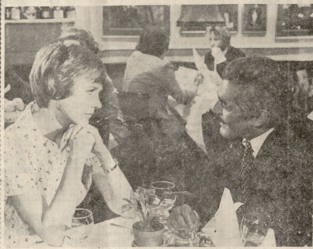
ΣΤΗΝ «Αστρία» θα προβληθεί ή ταινία: «Αγάπησα έναν κατάσκοπο», στην όποια πρωταγωνιστούν δυο ιερά τέρατα τής 7ης τέχνης: ό "Ομάρ Σαρίφ και ή Τζούλυ Αντρους. Γυρίστηκε στις άραιές μεγαλουπόλεις τής Εύρώπης και στα νησιά τής Καραβαϊκής... Μιά υπάλληλος του ύπουργείου "Εσωτερικών έρωτεύεται ένα Ρώσο κατάσκοπο. Τό κακό έγινε στα νησιά Μπαρμπάντος και εκδηλώθηκε στο Παρίσι... "Εξαιφερόσασ ταινία ή όποια έχει πολλά θετικά σημεία.

• ΕΝΩ όλα τά... σήριαλ πρόκειται να καταργηθούν, ένα φαίνεται ότι θα παίζεται γιά πολλά χρόνια ακόμη. Πρόκειται γιά τό... σήριαλ τής πληρώσεως τών τριών κενών Μητροπολιτικών έδρών τής "Εκκλησίας Κρήτης, που είμαστε δέβαιοι ότι σε κανένα δέν άρρέσει. Θυμάμαι πριν μερικά χρόνια που ό Σπυριδού είχεν ύποσχεθεί στους κατοίκους του Σπηλιού ότι σε λίγες μέρες θα είχεν Μητροπολίτη. "Αν αντί γιά μερες τούς έλεγαν... τέρμενα, τότε ήταν μέσα στα χρονικά περιθώρια. Κύριε έλέησον!