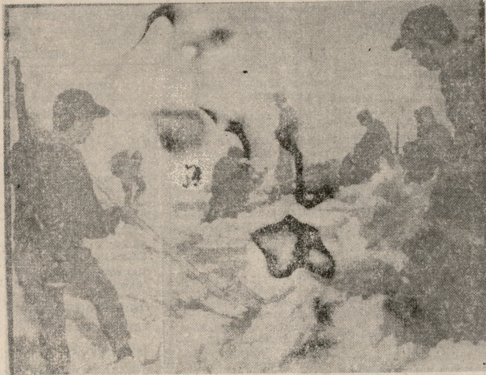
Άνδρες των Λόγων Όρειών Καταδρομών άφου άναρρήθησαν στην χιονισμένη κορυφή σκάβουν τή χιόνι για νά ξεβράσουν τή συντήρησι τού Γερμανικού αεροπλάνου ή νά άνακαλύψουν πτώματα.

Καμμία εξήγηση δέν μπορεί νά δοθή σχετικά με τή δυστύχημα τού «Γράνζαλ» τής Γερμανικής άεροπορίας που συνετρίβη την Κυριακή στην Κρήτη, λίγη πριν προσγειωθεί στο άεροδρόμιο τής Σούδας κοντά στα Χανιά.