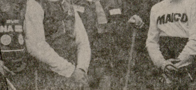
Φωτογραφικά στιγμιότυπα από την επίδειξη. Φωτορεπορτάζ: ΚΟΥΛΑΤΣΟΓΛΟΥ τηλ. 282934