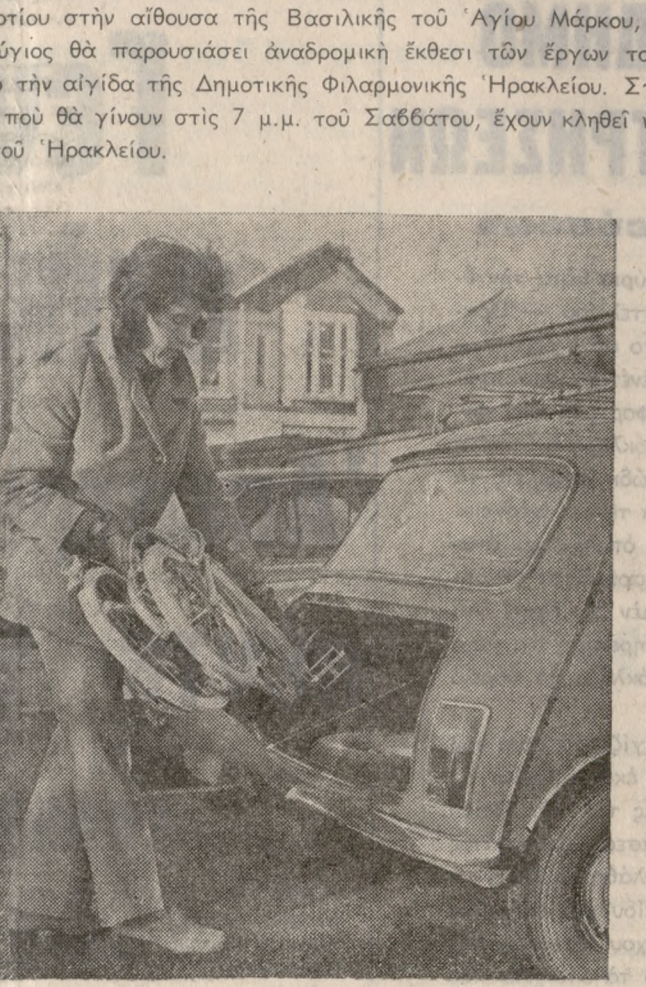
Τό νέο φορητό ποδήλατο Μπίκερτον Πόρταμπαλ πού ζυγίζει μόνο 8 κιλά, χωρεί άνετα σέ πόρτ - μπαγκάζ αυτοκινήτου.

ΑΠΟ τόν ΕΛΤΑ ανακοινώθησαν τά κάτωθι: «Άνακαινούται, ότι επί τής «70ετηριδής τής επαναστάσεως τού Θερίσου» θα χρησιμοποιηθή ειδική αναμνηστική σφραγίς κα τά τήν 10ην Μαρτίου ε.ε. υπό τού Κεντρικού Ταχ. Γραφείου Χαλίου. Οί ενδιαφερόμενοι διά τήν λήψην άποτυπώματος τής έν λόγω σφραγίδος δέον όπως καταθέσουσι ή άποστείλουσι έγκαίρας είν τό αναφερόμενον Γραφείον τά άντικείμενα των, φέροντα ταχυδρομικά τέλη, οι μέν φάκελοι δρχα. 4 τά δε δελτία δρχα. 3 τουλάχιστον. Τυχόν προσιζόμενα διά τό εξωτερικόν άντικείμενα, δέον όπως φέρουσι τά κατά περίπτωση άπαιτούμενα ταχυδρομικά τέλη.