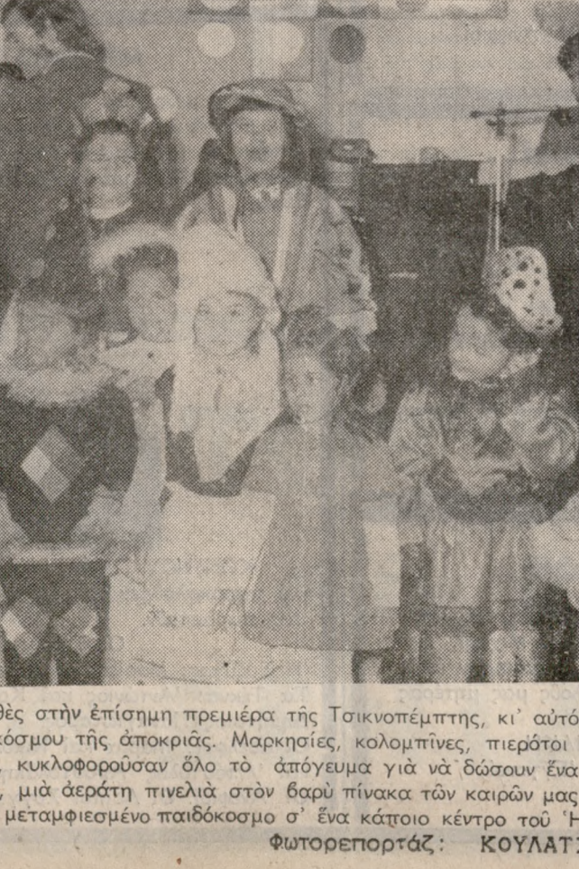
Ο παιδοκόσμος πέρασε χθές στην επίσημη πρεμιέρα της Τσιγκοπέμπτης, κι' αυτός, τό κατάφλι του φανταστικού και παρδαλλού κόσμου της άποκριάς. Μαρκετίες, κολομπίνες, πιερότοι και άρκελίνο, εύθυμες χαμογελάστες μινιατούρες, κυκλοφορούσαν όλο τό άπόγευμα για να δώσουν ένα κάποιο νόμο, μά νότα έλαφρότητας και εύθυμίας, μία όρατή πιελιά στον βαρύ πίνακα των καιρών μας. Στη φωτογραφία μας, ένας όμιλος άπ' τον χθεσινό μεταμορφωμένο παιδοκόσμο σ' ένα κάποιο κέντρο του 'Ηρακλείου.