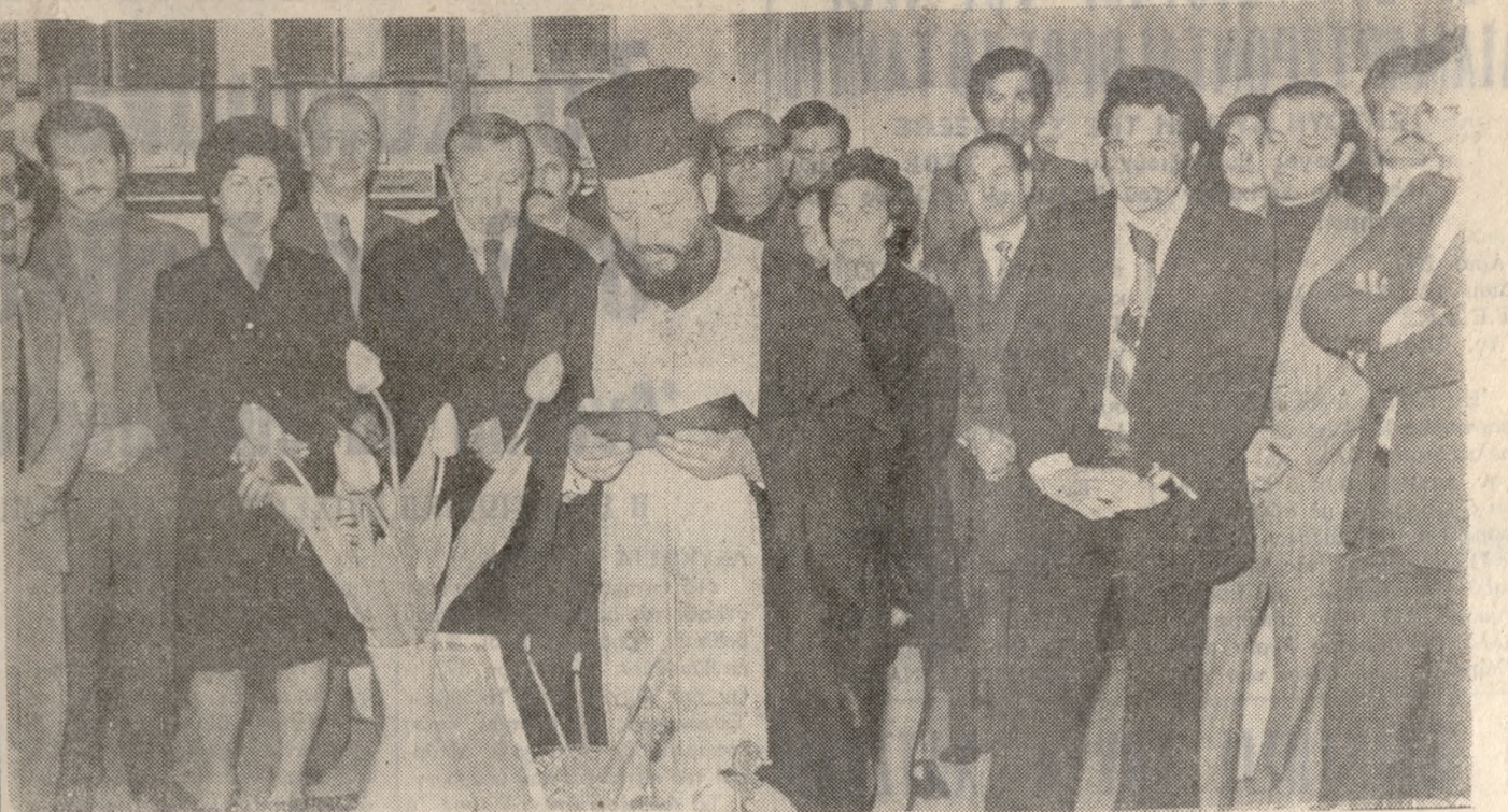
Χθές έγιναν τά εγκαίνια της 'Εκθέσεως στερεοφωνικών συγκροτημάτων του κ. Κουτράκη επί της οδού 'Εξένς. 'Ανωτέρω στιγμιότυπον άπό τά εγκαίνια.