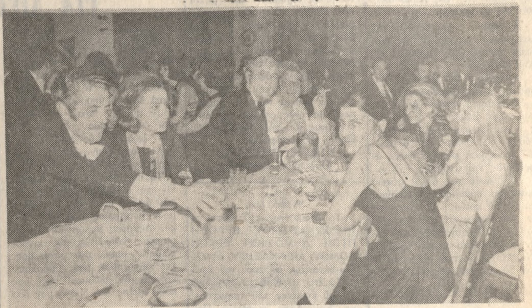
Στην ύπεροχα διακοσμημένη άποκρηάτικα αίθουσα του «ΞΕΝΙΑ» εδóθη τό π. Σάβ- βατον ό χορός του «ΤΕΝΝΙΣ». 'Ανωτέρω στιγμιότυπον άπό τόν χορό.

ΕΝΟΙΚΙΑΖΕΤΑΙ συγ- κρήμα γραφείων (3) πο λυτελέως κατασκευής έμού ή μεμενωμένως εύρισκόμε- να επί της πλατείας Μευ- σείου Πληρωφ. τηλ. 284013-232438.