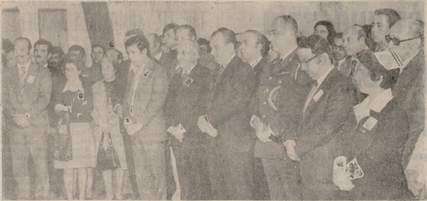
Με επιτυχίον συνεχίζεται η εβδομάς αιμοδοσίας η οποία ήρξεν από της Τρίτης εις την πόλιν μας και συνεχίζεται ήδη εις κομμάτι της του νομού. Τό άνωτέρω στιγμιότυπον είναι από την τελευταία ε- νάρξιν της εβδομάδος αιμοδοσίας.