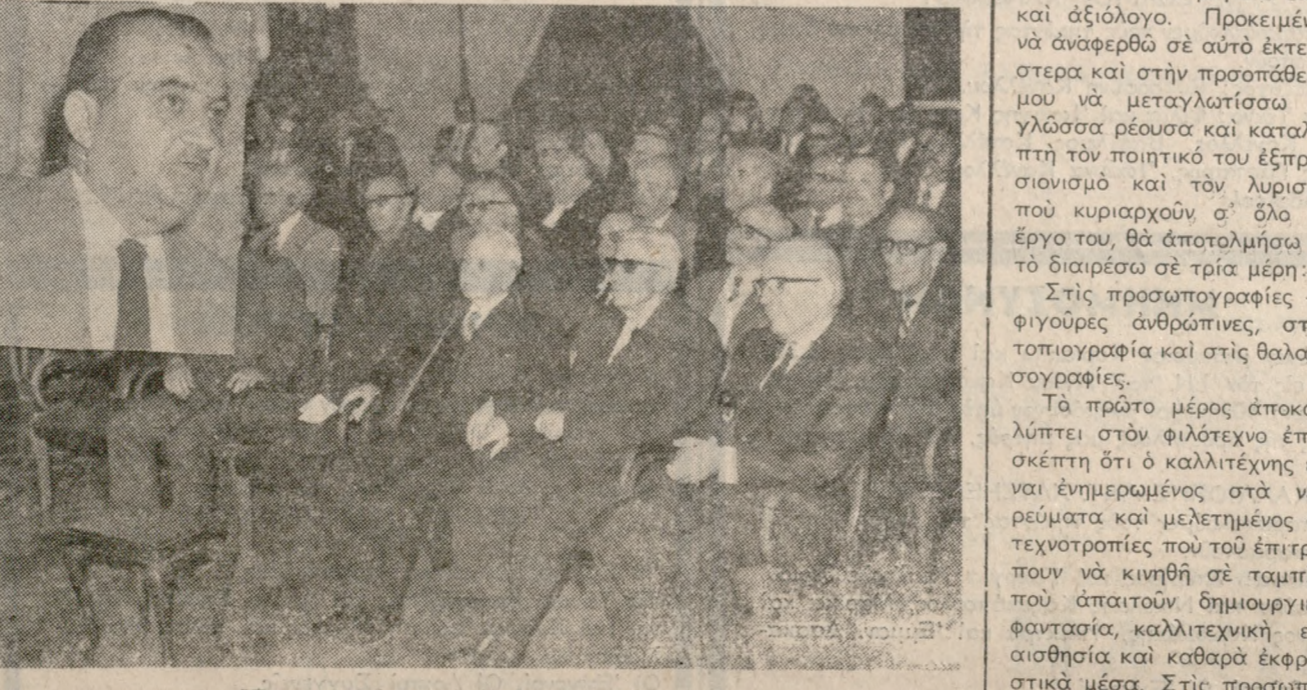
Ένα στιγμιότυπο από την ούσκειψη Φωτορεπορτάζ: ΚΟΥΛΑΤΣΟΓ ΛΟΤ' τηλ. 282934