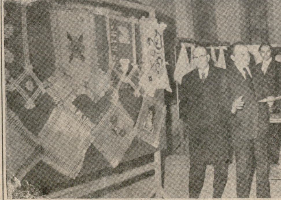
Μια γενική άποψη τής Έκθέσεως Χειροτεχνίας με έργα τών φυλακισμένων βαρυντηνών τών φυλακών Αλικαρνασού που έγκαίνιασθεκε προχθές τόν θράδυ τόν Βασίλειον τού Άγιου Μάρκου. Η Έκθεση σημειώνει μεγάλη έπιτυχία τόν άπό πλευράς προσελεύσεως, όσον και πωλήσεως Έργων. Η Έκθεση θα διαρκέση μέχρι και τής 25ης τρη.

ΕΥΓΕΝΙΣ ΔΟΡΕΑΙ Η κ. Μαρία Κασπακή κατέθεσε εις τή γραφεία μας τή ποσόν τών 1.000 δραχμ. εις μνήμην Άνδρέα Παπαδάκη ως εξής: 1) Δραχ. 500 ύπερ τού Γηροκομίου Ηρακλείου 2) Δραχ. 500 ύπερ τού Πανελληνίου Συνδέσμου Έπαγγελματικών Σπουδαστικών Ύποτροφιών.