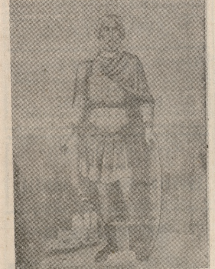
Ο ΑΓΙΟΣ ΜΕΓΑΛΟΜΑΡΤΥΣ ΜΗΝΑΣ ΠΡΟΛΙΟΥΧΟΣ ΚΑΙ ΠΡΟΣΤΑΤΗΣ ΗΡΑΚΛΕΙΟΥ

3ον. ΣΥΝΕΧΙΖΟΜΕΝ και σήμερα την δημοσίευση άποσπασμάτων σχετικών με την τελετή των έγκαίνων εκ της εφημερίδας «Ηράκλειον», του Βορεάδου, διότι παρουσιάζουν ιδιαίτερον ένδιόφερον. Όσαύτως θα δημοσιεύσωμεν άποσπάσματα έξα του λόγου τόν όποιον εξέφώνησεν, κατά τή έγκαίνια, ο μητροπολίτης Τιμόθεος.