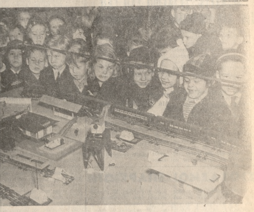
Τά παιδιά και τώ παιχνίδια. Σε μιά έκθεση που οργανώθηκε στη Γερμανία τώ παιδιά έδειξαν, κατά τήν φωτογραφία, τώ πρώτο βραβείο μακιγιάζ σε ένα μεγάλο διαγωνισμό που έγινε στην Σούησια