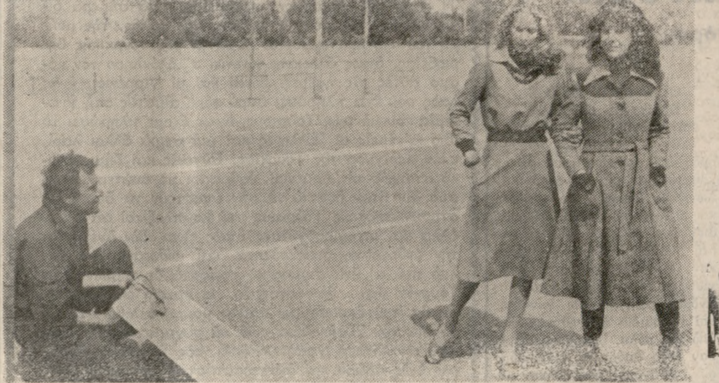
• ΑΥΤΕΣ τής μέρες βρίσκονται στο Ίράκλειο 40 καλλιγράμα μαυκενέ, που πραγματοποιούν ταξίδι εργασίας. Τα μαυκενέ έχουν «δισκοκορπίσει» σε διάφορες περιοχές τού νομού μας και τραβούν φωτογραφίες με τής οποίες ξένα περιοδικά θα λανσάρουν τήν φωτογραφικήν μόδα. Τα μαυκενέ φωτογραφίστηκαν μπροστά στον Άγιο Μηνά, στην Πλατεία Έλευθερίας, στην Χαλινόπορτα, στην Κνωσσό και σε διάφορες άλλες περιοχές. Τό παραπάνω στιγμιότυπο «τράβηξε» ο καλλιτέχνης φωτογράφος και συνεργάτης τής στήλης ΚΟΥΛΑΤΣΟΓΛΟΥ κάπου στην πλατεία Έλευθερίας.

ΕΙΡΤ 5.00 Λάσση 5.25 Έπικαιρα 5.35 Σας άπαντούμε 5.50 Στίς όχθες του Νείλου 6.45 Έλληνικοί χοροί 7.00 Εϊδήσεις 7.15 Η έβδομάδα που πέρασε 7.30 Η θίασος τής Κυριακής 8.30 Αθλητική Κυριακή 9.00 Εϊδήσεις 9.30 Έλληνικός κινηματογράφος (Γάζωρος Σεργάν) —Φράκ Σινάτρα —Εϊδήσεις ΥΝΕΝΔ 11.00 Παιδικό πρόγραμμα 11.30 Μαθήματα άγγλικής 12.00 Δημοτικοί χοροί και τραγουδια 12.30 Φοιτητικοί και νεανικοί παλμοί 1.45 Τό γεγονός τής έβδομάδος 2.00 Τηλεφημίες 6.00 Η εισόδος του Κυρίου στα Ίερωσώματα 6.30 Σύγχρονη Εύα 7.00 Μετάδοση τής Ακολουθίας του Νυμφίου 9.00 Ματιές στα σπόρ 9.15 Έβδομαδιαία διεθνής έπικαιρότης 9.30 Τηλεφημίες 10.00 Άνθράκινες Ιστορίες 10.45 Δύσκολα χρόνια 11.30 Η ΥΝΕΝΔ σάς ενημερώνει —Τηλεφημίες