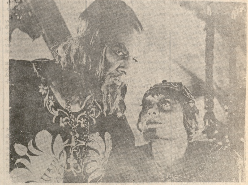
Έπιτέλους προβάλλεται τώ άριστούργημα τώ Ρωσικού Κινηματογράφου