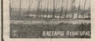
ΔΗΜΗΤΡΑ ΓΑΛΑΝΗ ο κάμπος

• Η ΔΥΣΧΕΡΜΙΑ που βγαίνει από τους όχετους Κατσαμπά και Πόρου (παλιά μπάνια) έχει και νει άφόρητη τή ζωή τών περιού