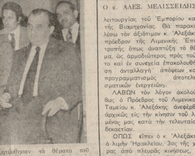
Συμπόσιον από την χθεσινή σύσκεψιν κατά την οποίαν ελετήθησαν τα θέματα του λιμένου μας.

Εις την σειράν τών επιδιώξεών μας έδώσαμεν άμεσον προτεραιότητα εις τόν λιμένα μας ήτοι της συνεχώσεως τών λιμενικών έργων διότι διά της όλο κληρώσεως αυτών θα δημιουργηθώιν αι προϋποθέσεις της όμολης εύρύθμου και άποδοτικής