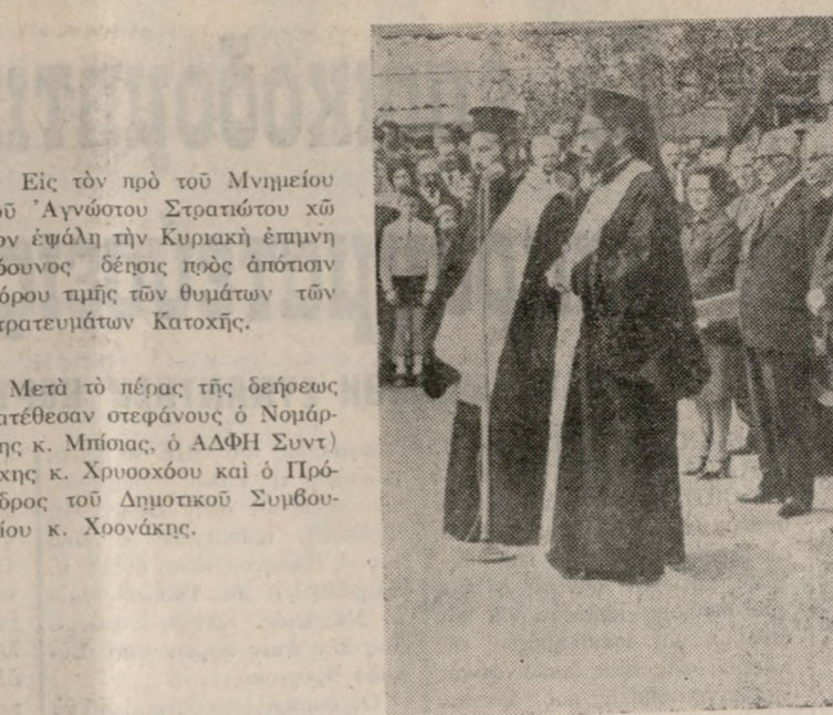
Εις τόν πρό τού Μνημείου τού Άγνώστου Στρατιώτου κώρον ένώλη την Κυριακή έμπνευμύνος δέσους προς άποπαιν φόρου τιμής τών θυμάτων τών στρατευμάτων Κατοχής.