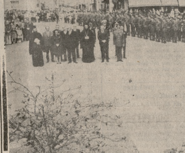
Δύο στιγμιότυπα από τας εκδηλώσεις τών Άρμενίων εις τήν πόλιν μας. Φωτορεπορτάζ: ΚΟΥΛΑΤΣΟΓΛΟΥ τηλ. 282934