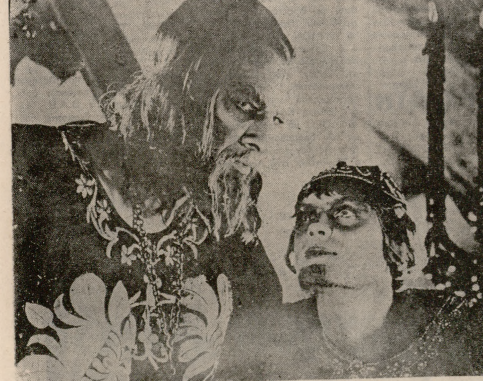
Έπιτελους προβάλλεται τό άριστούργημα τού Ρωσικού Κινηματογράφου