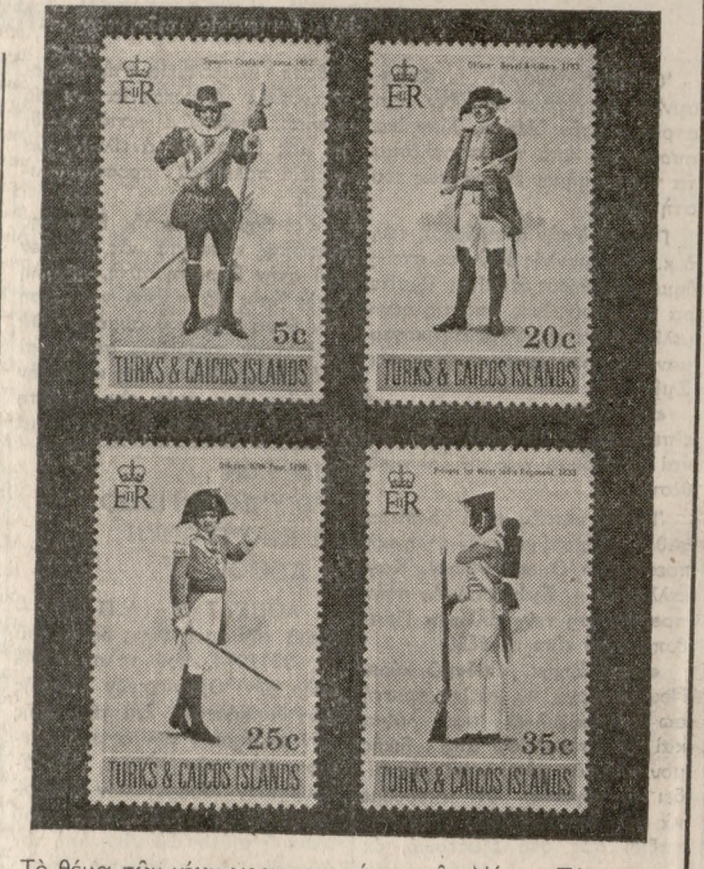
Τό θέμα τών νέων γραμματισμών τών Νήσων Τέρκς και Καϊκος είναι στρατιωτικές στολές τού παρελθόντος.

'Η μουσική τής «Μεγάλης 'Αγρυπνίας», στή μελωδική τής σύλληψη, έχει καταβολές στό Βυζαντινό μέλος και στή Δημοτική μουσική. Τα στοιχεία τής παράδοσης, είναι άφομοιωμένα έμε μέ τήν άμεση έπαση πού ή συνθετρία είχε μέ τά παρρατάνα μουσικά είδη στά παιδια κα τής χρόνια, είτε μέσω τού ρεμπέτικου και κυρίως τού έντεχνου ελληνικού τραγουδιού, πού όπως όμολογεί ή ίδια, έπαιξε σπουδαίο ρόλο, στήν εξέλιξη τής 'Η έγρηγορησής, διαμορφώνει ένα προσωπικό ύφος στά τραγούδια. 'Εδώ τά στοιχεία άνήκουν σέ μιά μεγάλη κλίμακα