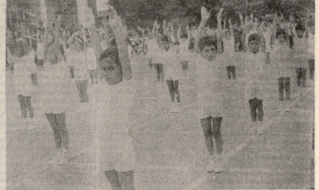
Ένα φωτογραφικόν στιγμιότυπον από τάς Γυμναστικάς Έπιδείξεις του 9ου Διημοτικού Σχολείου Ηρακλείου.

ΕΝΤΥΠΩΣΙΑΚΗΝ έπιτυχίαν έσημείωσαν αϊ Γυμναστικά Έπιδείξεις τών μαθητών και μαθητριών του 9ου Διημοτικού Σχολείου, αϊ όποια έτελέσθησαν χθές τώ άπόγευμα εις τήν εύρύχωρον αίθλην του Σχολείου. ΟΙ γονείς και κηρύμονες τών μαθητών, οι όποιοι παρρηλοκόησαν τάς Γυμναστικάς Έπιδείξεις άπεκάρησαν με τάς καλύτεράς τών έντυπώσεων, άφού συνεχάρησαν τούς Διευθυντάς και τάς διδασκάλλους του Σχολείου, εις τάς άόκους προπαθείας τών όποιων όφειλεται τώ ύπεροκον θεάμα τώ όποιον παρρηλοκόησαν.