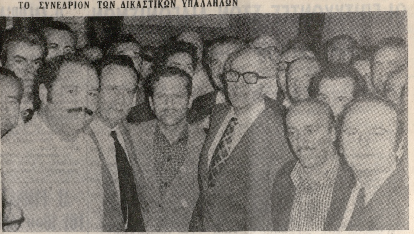
Φωτογραφικών στιγμιότυπων από τό Συνέδριον των Δικαστικών Υπαλλήλων. Διακρίνεται εις τό μέσον ο Υπουργός Δικαιοσύνης κ. Στεφαννάκης και παραπλεύρωσ αυτού ο νέος Πρόεδρος της Ομοσπονδίας Δικαστικών Υπαλλήλων, συμπολίτης κ. Α.Α. Παπαπέτρης.

Συμφώνως τω Νόμω και τω άρθρω 24 του Καταστατικού καθοδνται οι κ.κ. Μέτοχοι εις ή τριαν τακτική Γενική Συνέλευση γεννησομένη την 28ην Ιουνίου 1975 ήμεραν Σάββατον και ώραν δην έσπερινήν, εις τό έν Αμνέτι Χερσονήσου "Ηρακλείου" Κρήτης και έντός του Ξενοδοχείου "BELVEDEERE" γραφεία της "Εταιρίας με άμειωσ. Τίσιτα δεν μπορεί τό κάποιος γιά να μεταδώσει τό διαταγή. Στο σπύ άν τόβρισκε μασιούνια. Κι άν δεν έρθεει καμαρού θεία τό ή καμιά γιολιά του να κανονίσει τό πάντα τα και να τον γλυτώσει, πού πρέπει να γυρίσει πίσω στη φυλή του ή να παντρευτεί σέ καμιά άλλη φυλή. Οι γυναίκες έχουν μεγάλη δύναμη. "Όταν ή πάρχει ανάγκη δεν διατάζουν να κάρηδουν τον πατρο άπ' τό κέρτατα, να διάδουν άλλον άρχηγό και να τον υποβιβάσουν στην κατηγορία του άλλου πολημοτή. "Ετσι, ή έκλογή του άρχηγού μένει πάντα στη δικαιοδοσία τους". (Συνοχίζεται) ΠΩΛΕΙΤΑΙ ΦΙΑΤ 850 σπύτα, εις άριστην κατάσταση. Πληρωμή μετρητοίς. Πληροφορία τηλ. 282934. 1-6