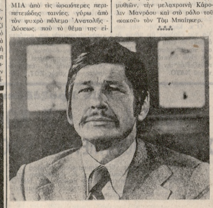
Ο ΤΣΑΡΛΣ ΜΠΡΟΝΣΟΝ ΣΤΟΝ «ΜΑΥΡΟ ΚΥΚΛΟ»

«ΔΥΟ ΞΕΝΟΙ ΣΤΗΝ ΙΔΙΑ ΠΟΛΙ» ΠΛΟΥΣΙΑ ἡ ταινία καὶ μετ' ἀπί- στευτα «τρίκ» ποὺ ζωντανεῖον εἶδωλα, ἀκρόφωρα, μονόφθα- λμοις κεντάρους καὶ νυκτερί- δες μικρόφωνα, ἔχει πλοῦστο καὶ ἐκλεκτὸς πρωταγωνιστῆς. Τὸν ψηλὸ, ἔαθθ, ὠραῖο Τζῶν Φίλιπ Λῶ, ὁ ὁποῖος ὕστερα ἀπὸ τολημρὰ ἔργα δεῖναι διδάσει νὰ γίνῃ ἥρωας παιδικῶν παρα- μυθῶν, τὴν μελαχροινὴ Κάρ- ολιν Μανρόου καὶ σὸ ρόλο τοῦ «κακοῦ» τὸν Τὸμ Μπάρκερ.