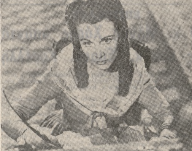
Η «ΛΑΙΔΗ ΧΑΜΙΛΤΟΝ» ΠΟΥ ΤΟΣΟ ΘΑ ΑΡΕΣΗ

«ΤΑ ΦΩΤΑ ΤΗΣ ΡΑΜΠΑΣ» ΤΟ συγκλονιστικὸ ἀριστοῦργη- μα τοῦ Τοῦρλου Τοῦσλιν, ποὺ συγκλίνει τόσο ὅταν παρουσιάζ- οται. Τὸ σενάριο, ἡ σκηνοθε- σία καὶ ἡ μουσικὴ τοῦ ὀφείλου- νται, ὅπως πάντα φυσικὰ στὸν ἴδιο. Συμπρωταγωνιστοῦν μαζὶ τοῦ ἡ Κλαίρη Μιλοῦμι καὶ ὁ γιὸς τοῦ Σπέννευ Τοῦσλιν. Μία ταινία ποὺ ἔχει τὴν ὑπογραφή τοῦ μεγαλύτερου καλλιτέχνη ποὺ φάνηκε ποτὲ στὸν κινη- ματογράφου, τοῦ Τοῦρλου Τοῦσλιν ὅσα χρόνια κ' ἂν περάσουν εἰ-