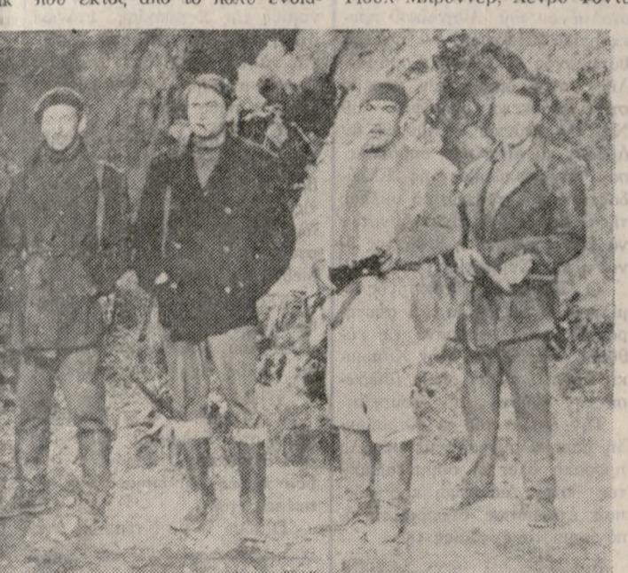
ΕΝΑ ΕΚΛΕΚΤΟ ΕΠΙΤΕΛΕΙΟ ΗΘΟΟΠΩΝ ΓΙΑ ΤΑ «ΚΑΝΟΝΙΑ ΤΟΥ ΝΑΒΑΡΟΝΕ».

φέρουν θέμα τῆς, ἔχει πολὺ κα- λὴ ἐρμηνεία καὶ τὸ σπουδαίτε- ρο ἐκπληκτικὴ σκηνοθεσία. Ἐλγα ὁ θεατῆς μεταφέρεται σὲ μὴ ἐ- ποχὴ — ἱεραρομένη βέβαια σήμε- ρα — ποὺ οἱ βασιλεῖς ἦ- σαν κυρίαρχοι καὶ στὰ παλάτια γίνονταν μυθικὲς ἐκδηλώσεις ἢ παίζονταν κρυφὰ δράματα, ἐνῶ ὁ λαὸς στέναζε, οὐ μὴ ἐποχὴ ποὺ ἡ ἱστορία ἔχει ἦδη γράψει τὴ λέξη ἐπέλθοι. Τὸν «τελλὸ βασιλιά» ὑποδύεται ὁ πὺ γο- τευτικὸς καὶ περιζήτητος σὴμ- ρα ἱθόσοι τοῦ κινηματογράφου, ὁ Χέλμυτ Μπέργκερ. Πλάι του, τὸ ἴδιο γοτευτικὴ ἢ Ρόμυ Σνάντερ.