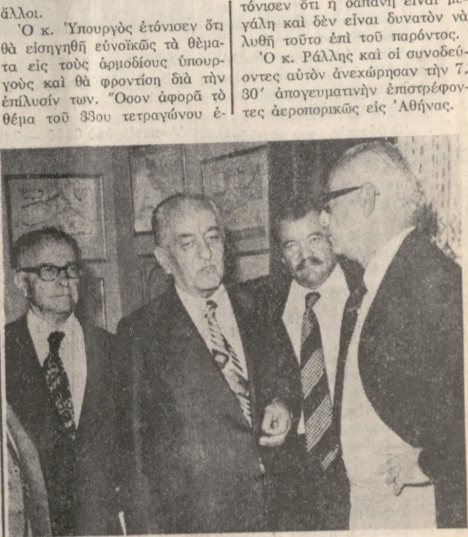
ΑΠΟ ΤΗΝ ΕΠΙΣΚΕΨΙΝ ΤΟΥ Κ. ΡΑΛΛΗ (ΔΕΞΙΑ). ΔΙΑΚΡΙΝΟΝΤΑΙ ΕΠΙΣΗΣ Ο ΒΟΥΛΕΥΤΗΣ Κ. ΕΜΜ. ΚΕΦΑΛΟΓΙΑΝΝΗΣ ΚΑΙ ΟΙ ΠΡΟΕΔΡΟΙ ΤΟΥ Ε.Μ. Κ. ΜΕΛΙΣΣΕΙΔΗΣ ΚΑΙ ΤΗΣ ΕΓΣΗ Κ. ΚΑΡΑΝΤΙΝΟΣ.

Άλλοι. 'Ο κ. Υπουργός έντόνησεν ότι θα εισηγηθή έννοικάς τά θέματα εις τούς αρμοδίους ύπουργούς και θα φροντίσιν δια τήν επίλυσιν των. 'Οσον άφορά τόν θέμα τού 33ου τετραγώνου έν- τόνισεν ότι ή δαπάνη είναι μεγάλη και δεν είναι δυνατόν να λυθή τούτο επί τού παρόντος. 'Ο κ. Ράλλης και οι συνοδευόμενοι αυτών άνεχώρησαν τήν 7.30' άπογευματινήν έπιστρέφοντες άεροπορικώς εις 'Αθήνας.