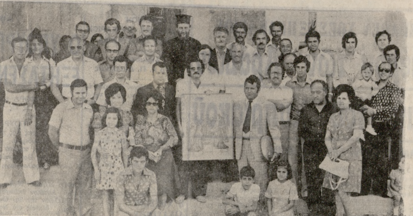
Προχθές έορτήν τού 'Αγίου Πνεύματος οι φωτογράφοι τού 'Ηρακλείου είχαν τήν έτησίαν έορτήν των. Τήν πρώαν έλεγομένην εις τόν Ιερόν ναόν τού 'Αγίου Ιωάννου και τού άπόγευμα εξέδρασαν εις Μπαλί. Τό άνωτέρω στιγμιότυπον έλήφθη μετά τήν λειτουργίαν εις τόν 'Αγιον Ιωάννην.