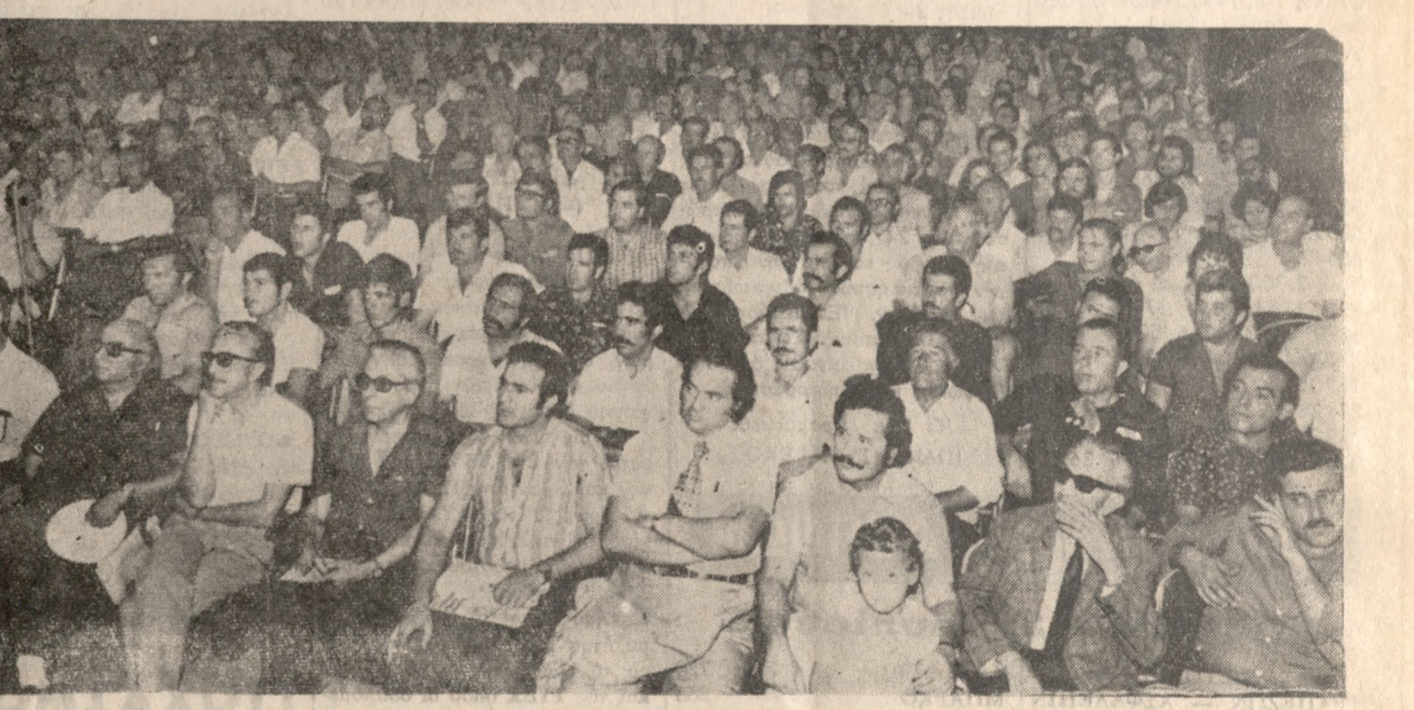
Στελέχη και όπαδοί τού Π.Α.Σ.Ο.Κ. παρακολουθούν τ'ήν όμιλία τού "Αρχηγού κ. ΑΝΔΡΕΑ ΠΑΠΑΝΔΡΕΟΥ στό "ΝΤΟΡΕ", τ'ήν Κυριακή τ'ό πρωί.