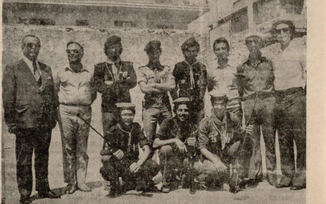
Φωτογραφικοί στιγμιότυποι ληφθέν ολίγον μετά την λήξιν των Παγκρητίων Σκοπευτικών Προσκοπικών Αγώνων.