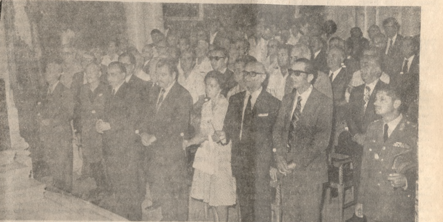
Διό φωτογραφίες από τ'ό προχθεσινό μνημόσυνο στον "Άγιο Μηνά για τ'ά θύματα τ'ής Κυπριακής τραγωδίας. Στη μιά ΕΠΑΝΩ επίσημοι και κόσμος και ΚΑΤΩ επίσημοι και συγγενείς τών παιδιών πού χάθηκαν.

"Υστερα από πολλά - πολλά χρόνια γεύση έκλογών στό Τε- χνικό "Επιμελητήριο "Ηρακλεί- ου, "Αρχαιρείται για άνάδειξη διοικήσεως πού άπαθανάτιζον- ται από τόν φωτογραφικό φακό, και από τις όποιες σε λίγο θ'ά ανάδειχθή ή πρώτη αειρήτη διοί- κησης.