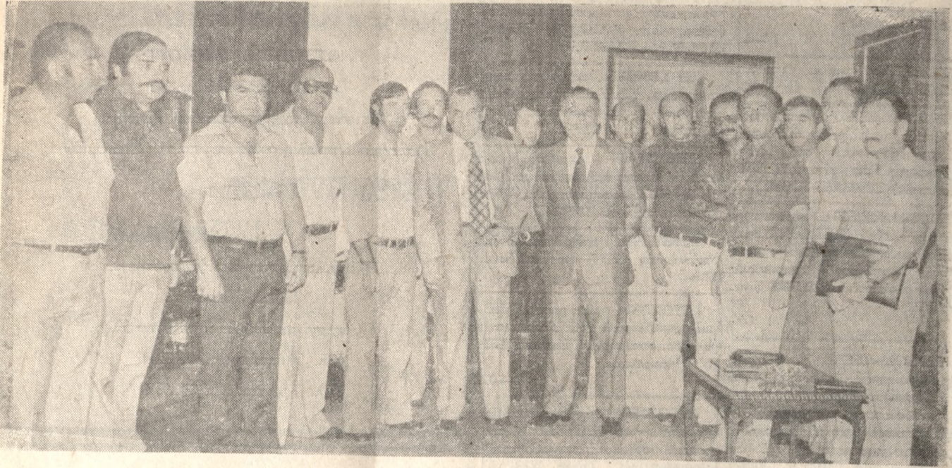
Φωτογραφικό στιγμιότυπο ληφθ' εν λίγο πριν από την έναρξη της χθεσινής συσκέψεως για τὸ κολυμβητήριον. Στο κέντρο τῆς φωτογραφίας ὁ Γεν. Γραμματεὺς Ἀθλητισμοῦ κ. Κασσιανόπουλος καὶ ὁ Νομάρχης κ. Μπίσιος...