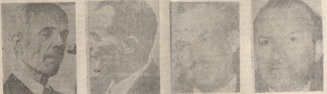
Ο ΟΔΥΣ. ΑΓΓΕΛΗΣ Ο ΣΤΕΦ. ΚΑΡΑΜΠΕΡΗΣ Ο Γ. ΚΩΝΣΤΑΝΤΟΠΟΥΛΟΣ Ο ΙΩΑΝΝΗΣ ΛΑΔΑΣ

ΤΟΥΣ ΜΕΤΕΦΕΡΕ ΧΘΕΣ ΤΟ ΜΕΣΗΜΕΡΙ ΣΤΡΑΤΙΩΤΙΚΗ ΝΤΑΚΟΤΑ